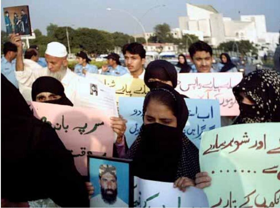
Manifestations contre les disparitions forcées devant la Cour suprême du Pakistan.