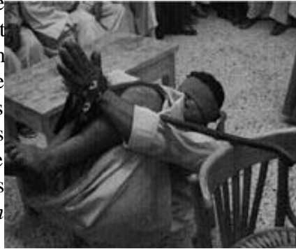
Reconstitution d'une méthode de torture utilisée en Égypte

Le gouvernement égyptien continue de nier que le recours à la torture et aux mauvais traitements est systématique dans de nombreux lieux de détention dans tout le pays, en particulier dans les postes de police et les locaux du Service de renseignements de la sûreté de l'État. Malgré les preuves accablantes de l'existence d'une pratique généralisée de la torture, les autorités égyptiennes ne reconnaissent que « des cas isolés de violation des droits humains 3 ».