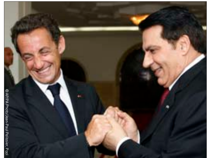
الرئيس الفرنسي الفرنسي نيكولا ساركوزي أثناء حفل استقبال في تونس.

للحصول على مزيد من المعلومات عن محنة المعتقلين في تونس، انظر تقرير: «تونس: التعذيب والاعتقال غير القانوني والمحاكمات الجائرة» (MDE 30/005/2008).