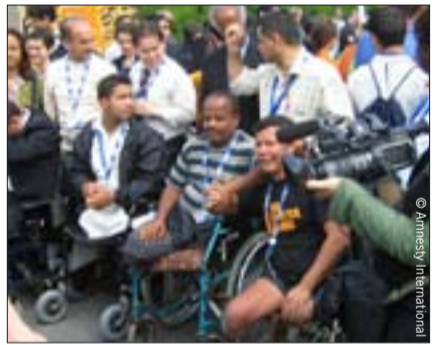
الناجون من القنابل العنقودية من كمبوديا وصربيا وإثيوبيا يحضرون مؤتمر حظر الأسلحة والذخائر العنقودية في العاصمة الأيرلندية دبلن، 30 مايو/ أيار 2008.

ومما له دلالة هامة أن المعاهدة تفرض حظراً مطلقاً على الأسلحة والذخائر العنقودية؛ ولا تسمح بأي فترة انتقالية ولا تمييز أي استثناءات. كما تفرض المعاهدة التزامات واضحة بتقديم المساعدة الإنسانية للضحايا والمجتمعات