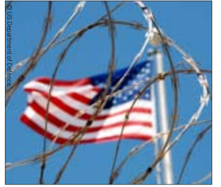
العلم الأمريكي يرفرف فوق معسكر «كامب دلتا»، بالقيادة البحرية في خليج غوانتانامو، كوبا.

كما رفضت المحكمة النظام الذي أنشئ ليكون بديلاً عن المثول أمام القضاء للبت في مشروعية الاعتقال باعتباره نظاماً قاصراً، وهو نظام المراجعة القضائية لقرارات محاكم إعادة النظر في وضع المقاتل، واللجان العسكرية المخولة بإعادة النظر في وضع المعتقل من حيث كونه «مقاتلاً عدواً». ورغم تعهد الرئيس الأمريكي جورج بوش بأن «تلتزم إدارته بقرار المحكمة»، فقد قال إنه