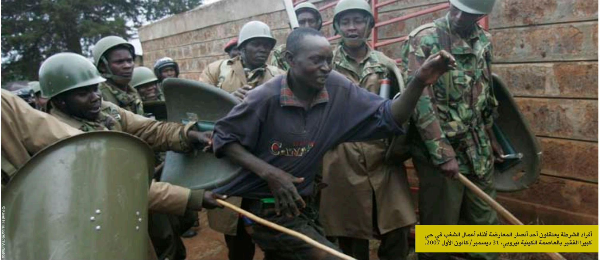
أفراد الشرطة يعتقلون أحد أنصار المعارضة أثناء أعمال الشغب في حي كيبيرا الفقير بالعاصمة الكينية نيروبي، 31 ديسمبر/كانون الأول 2007.

عندما يرتكب رجال الشرطة أنفسهم الجرائم دون خوف من إجراء تحقيقات أو إنزال عقاب بهم، فمن الذي ينتصر لحكم القانون إذن؟ ففي كثير من البلدان عبر القارة الإفريقية، تنتهك الشرطة حقوق الإنسان بممارسة التعذيب أو بالإفراط في استخدام القوة. وفي الغالب لا يتم التحقيق في سلوكهم حتى عندما يقتل الأشخاص، وقلما تتم مساءلتهم عما اقترفوه.