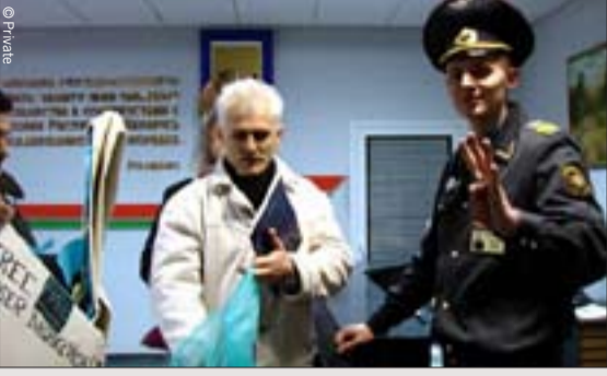
نموذج ورقي ضخم لطائر الغرنوق يتم تسليمه لوزارة الداخلية في العاصمة البيلاروسية مينسك، 13 ديسمبر/ كانون الأول 2007.

يبدو أن حملة العفو الدولية من أجل حرية التعبير في بيلاروس قد بدأت تؤتي أكلها حيث تجلت آثارها على سياسة الحكومة. فالمادة 193(1) من قانون العقوبات البيلاروسية تجيز معاقبة منظمات المجتمع المدني وغيرها من الجماعات التي تنتقد الحكومة على ما تمارسه من أنشطة؛ ومن ثم فإن أي نشاط تنظمه أو تشارك فيه منظمة غير حكومية غير مسجلة يعد جريمة يعاقب عليها القانون الجنائي بالسجن لمدة لا تزيد على سنتين.