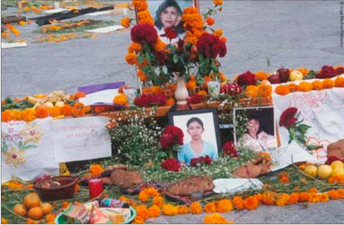
مظاهرة في كويرنافاكا، بولاية موريلوس، لإحياء ذكرى ضحايا العنف من النساء، والمطالبة بالإنصاف، نوفمبر/تشرين الثاني 2006.

أغسطس/آب 2008، المجلد 38، العدد 7 رقم الوثيقة: 2008/007/21 NWS