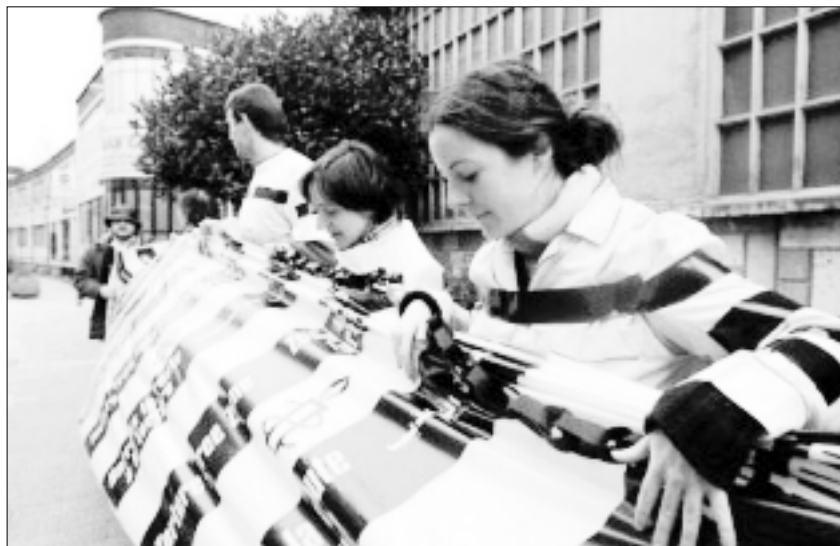
Miembros de Amnistía Internacional en España participan en la presentación del informe de la organización titulado Un comercio execrable: el comercio de la tortura , febrero del 2001.

En respuesta a la magnitud del problema, las Naciones Unidas (ONU) tienen previsto celebrar, en julio del 2001, una conferencia internacional sobre el tráfico ilícito de armas pequeñas y ligeras en todos sus aspectos. El objetivo de la conferencia es acordar un Programa de Acción que contenga recomendaciones para los gobiernos. Amnistía Internacional acoge con satisfacción esta iniciativa, que debe proporcionar una oportunidad importante para desarrollar un programa internacional de acción que aborde la proli-