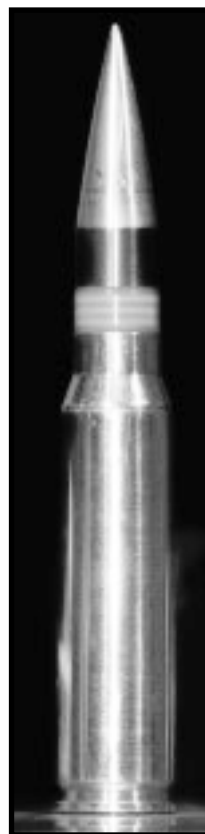
Proyectil de 30 milímetros con punta de uranio empobrecido.

Mientras no se cuente con estudios concluyentes sobre los efectos a largo plazo de tales armas para la salud y el medio ambiente, Amnistía Internacional seguirá preocupada por los efectos indiscriminados que este tipo de municiones pueda tener en la salud, especialmente la de los no combatientes. El ministro de Salud Pública de la Federación de Bosnia y Herzegovina ha informado de un reciente aumento en la incidencia del cáncer entre los civiles residentes en zonas donde se utilizaron municiones con capacidad para perforar materiales blindados en 1994 y 1995. El Ministerio de Salud