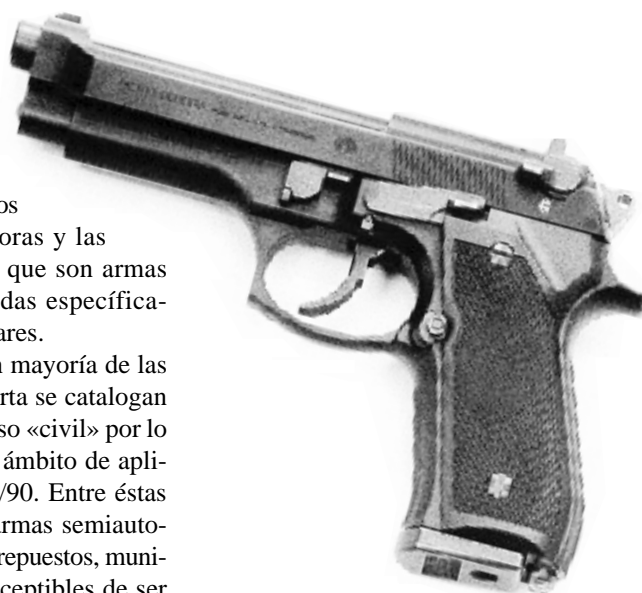
Pistola de fabricación italiana.

Normalmente ni siquiera las armas que la policía utiliza de forma habitual se consideran «armas de guerra». Esta laxa clasificación ha provocado una liberalización en el comercio de la mayoría de las armas semiautomáticas. El resultado ha sido catastrófico para los derechos humanos. Italia puede exportar «armas civiles pequeñas y ligeras» a países devastados por conflictos armados y por violaciones flagrantes de los derechos humanos, incluso cuando la transferencia de «armas militares» a estos mismos paí-