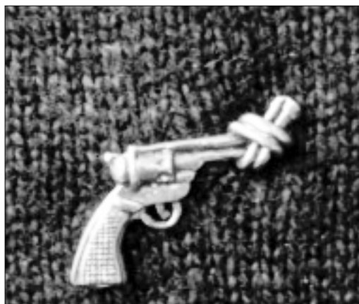
Chapa con la forma de una pistola anudada, producida por una ONG canadiense. La imagen está inspirada en una escultura ubicada frente al edificio de las Naciones Unidas en Nueva York.

Un informe publicado en 1995 calculaba que se estaban produciendo armas pequeñas con licencia en al menos 21 países en vías de desarrollo, 16 de los cuales también las exportaban. Los propios datos de la Fundación Omega ponían de manifiesto que 14 países — Austria, Bélgica, la República Checa, Francia, Alemania, Israel, Italia, Portugal, Sudáfrica, Singapur, Suecia, Suiza, el Reino Unido y Estados Unidos — han establecido acuerdos de producción bajo licencia para armas pequeñas y munición con otros 45 países. La expansión geográfica de instalaciones destinadas a la