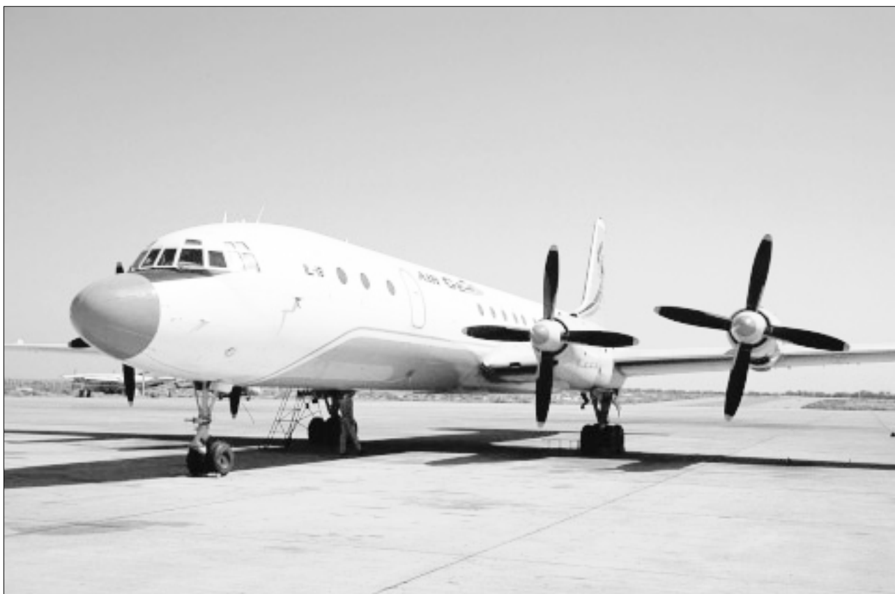
Un avión Ilyushin 18 de la compañía Air Cess, 1999. Air Cess tiene sus oficinas centrales en el aeropuerto de Sharjah, en los Emiratos Árabes Unidos, pero está registrada en Guinea Ecuatorial. Air Cess y su propietario ruso, Victor Bout, han sido acusados en cuatro informes recientes de las Naciones Unidas de vender armas a los rebeldes de la Unión Nacional para la Independencia Total de Angola (UNITA), al Frente Revolucionario Unido de Sierra Leona y a los rebeldes en la zona oriental de la República Democrática del Congo.

tintos acuerdos comerciales. Los transportistas tienen que asegurarse la disponibilidad de aviones de carga, normalmente mediante el arrendamiento de aviones o un contrato de fletamento con el propietario; por lo general también necesitan contratar a la tripulación y obtener autorización para atravesar el espacio aéreo de determinados países; han de contratar el almacenamiento temporal de las mercancías y contar con instalaciones para el estacionamiento y el mantenimiento técnico de los aviones; han de organizar y pagar la utilización de pistas