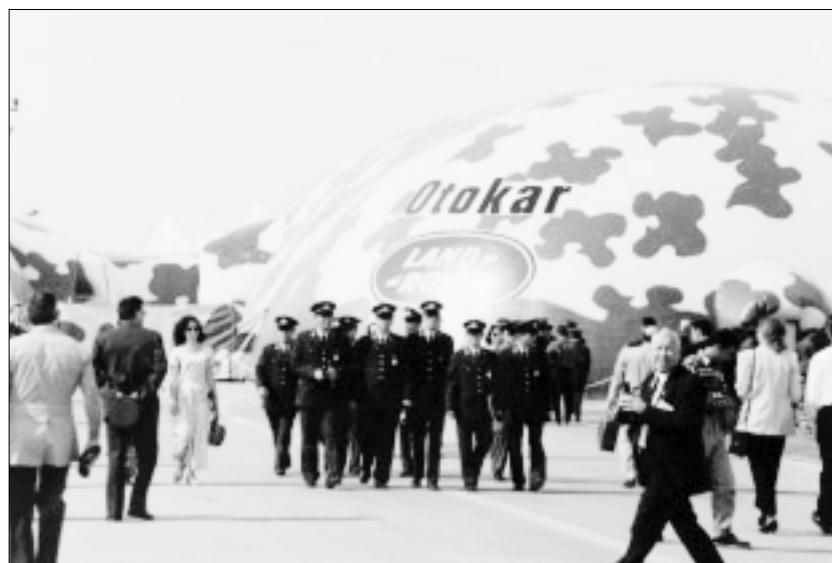
Un pabellón en la segunda Feria Internacional de la Industria Militar y de Aviación, Ankara, Turquía, 1995.

Durante 1999, la empresa turca MKEK (Makina ve Kimya Endüstri-si Kurumu) fabricó metralletas MP5 de la marca Heckler and Koch bajo licencia de la empresa británica BAE Systems-Royal Ordnance y de su filial alemana Heckler and Koch. Estas metralletas se exportaron a Indonesia entre finales de agosto y principios de septiembre de 1999, en una época en la que los paramilitares estaban cometiendo abusos generalizados contra los