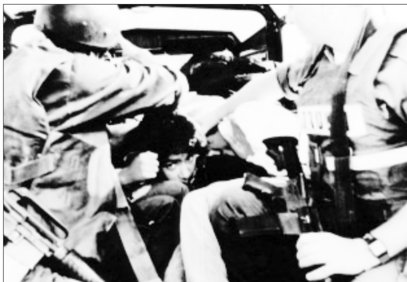
La policía de fronteras israelí detiene a un palestino en Jerusalén, octubre del 2000.

3. Aunque en ocasiones las fuerzas de seguridad empezaban lanzando gases lacrimógenos para dispersar a los manifestantes, a los pocos minu-