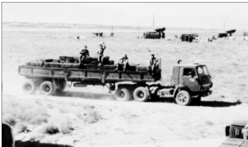
Fotografía tomada en junio de 1996 desde un avión que transportaba municiones desde Afganistán a Bratislava, Eslovaquia.

La Fundación Omega, con sede en el Reino Unido, ha efectuado recientemente un análisis de las tendencias que revelan los datos públicos disponibles referidos al periodo comprendido entre 1960 y 1999, y que señala un aumento a largo plazo del número de compañías y de países productores de armas pequeñas, especialmente durante el periodo subsiguiente a la Guerra Fría, caracterizado por una mundialización acelerada. Entre 1960 y 1999 se duplicó el número de países productores de armas pequeñas y se multiplicó por casi seis el número de empresas fabricantes de estas armas. Aunque parte del incremento tiene su