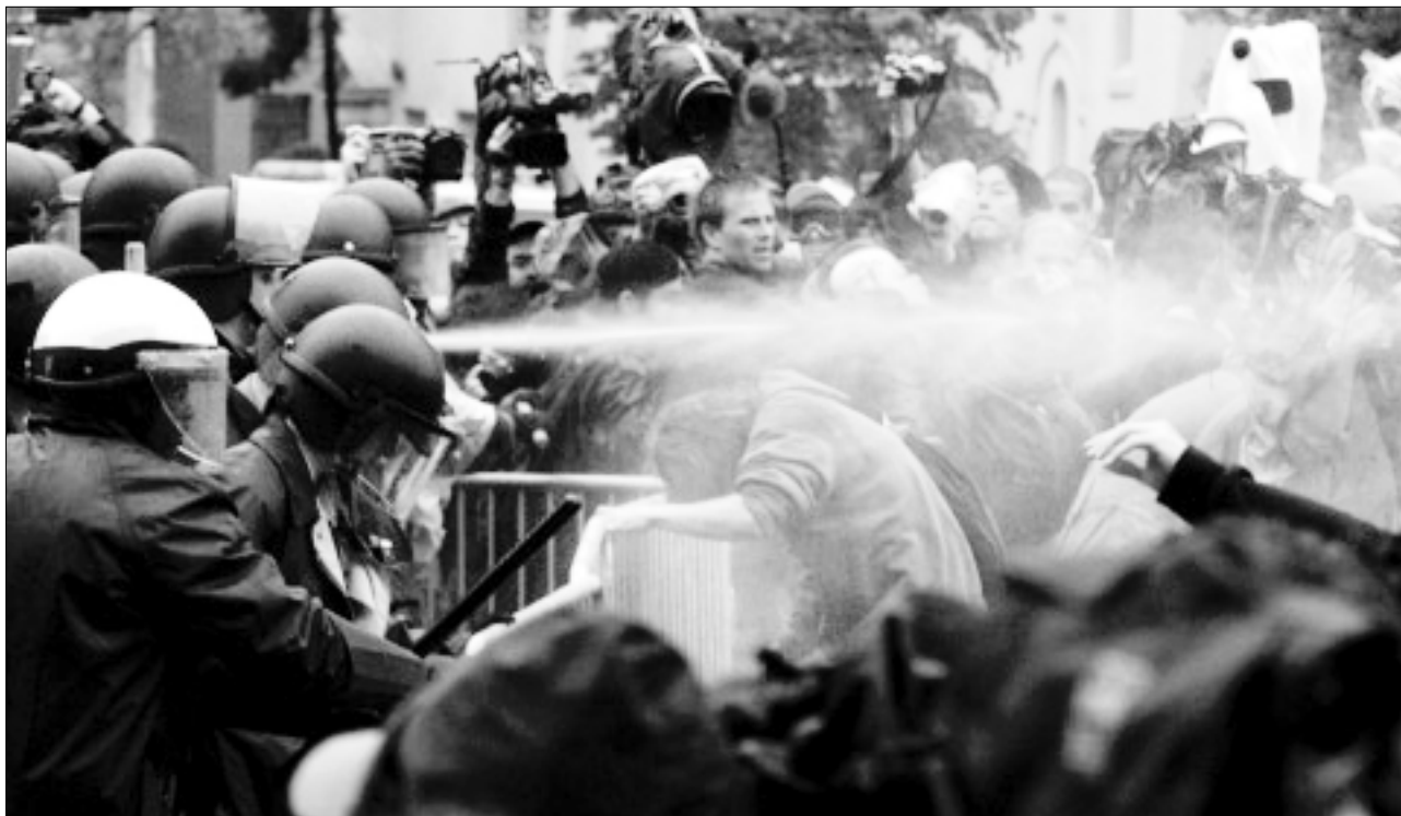
La policía dispara gas lacrimógeno contra los participantes en una manifestación de protesta contra el Fondo Monetario Internacional y el Banco Mundial celebrada en Washington DC, Estados Unidos, el 17 de abril del 2000.

El hecho de que las autoridades estadounidenses, cuando estudian las solicitudes de licencias de exportación para este tipo de material, no tengan en cuenta el grado de respeto a los derechos humanos en el país destinatario, aumenta claramente el riesgo de que se practique la tortura.