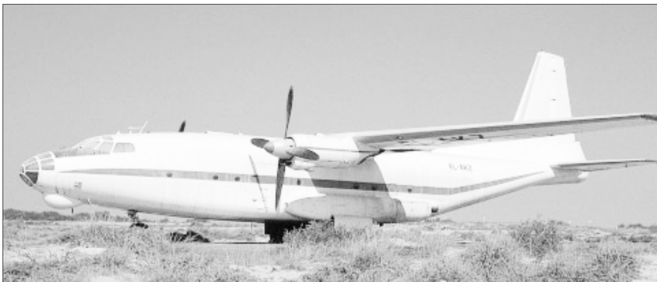
Una aeronave de carga, modelo Antonov 8 , perteneciente a la empresa de transporte aéreo Santa Cruz Imperial Airlines en el aeropuerto de Sharjah, en los Emiratos Árabes Unidos. Las Naciones Unidas acusaron al aeropuerto de Sharjah de ser «aeropuerto de conveniencia» para los aviones matriculados en muchos otros países, como Suazilandia, Guinea Ecuatorial, la República Centroafricana y Liberia. En octubre de 1998, la autoridad aeronáutica de Liberia retiró temporalmente de servicio 15 aviones de la flota Santa Cruz Imperial/Flying Dolphin que estaban matriculados en Liberia pero que operaban desde Sharjah. Los aviones ya habían sido investigados en Suazilandia y Sudáfrica y se les prohibió finalmente la entrada en los aeropuertos de estos países.

Pese a la suspensión de la importación, exportación y fabricación de armas pequeñas y ligeras impuesta en 1998 en la Comunidad Económica de Estados del África Occidental (CEDEAO), la región rebosa con este tipo de armas. Los grupos armados de oposición reciben armas y munición a través de redes interconectadas de comerciantes, delincuentes e insurrectos que atraviesan continuamente las fronteras. No existe información integral sobre el contrabando de armas y munición en la región, y no se cuenta con la información que se podría emplear para combatir el problema a escala regional —a través de la CEDEAO o de intercambios bilaterales—. Pocos países de la región disponen de los recursos o de la infraestructura necesaria para hacer frente al contrabando.