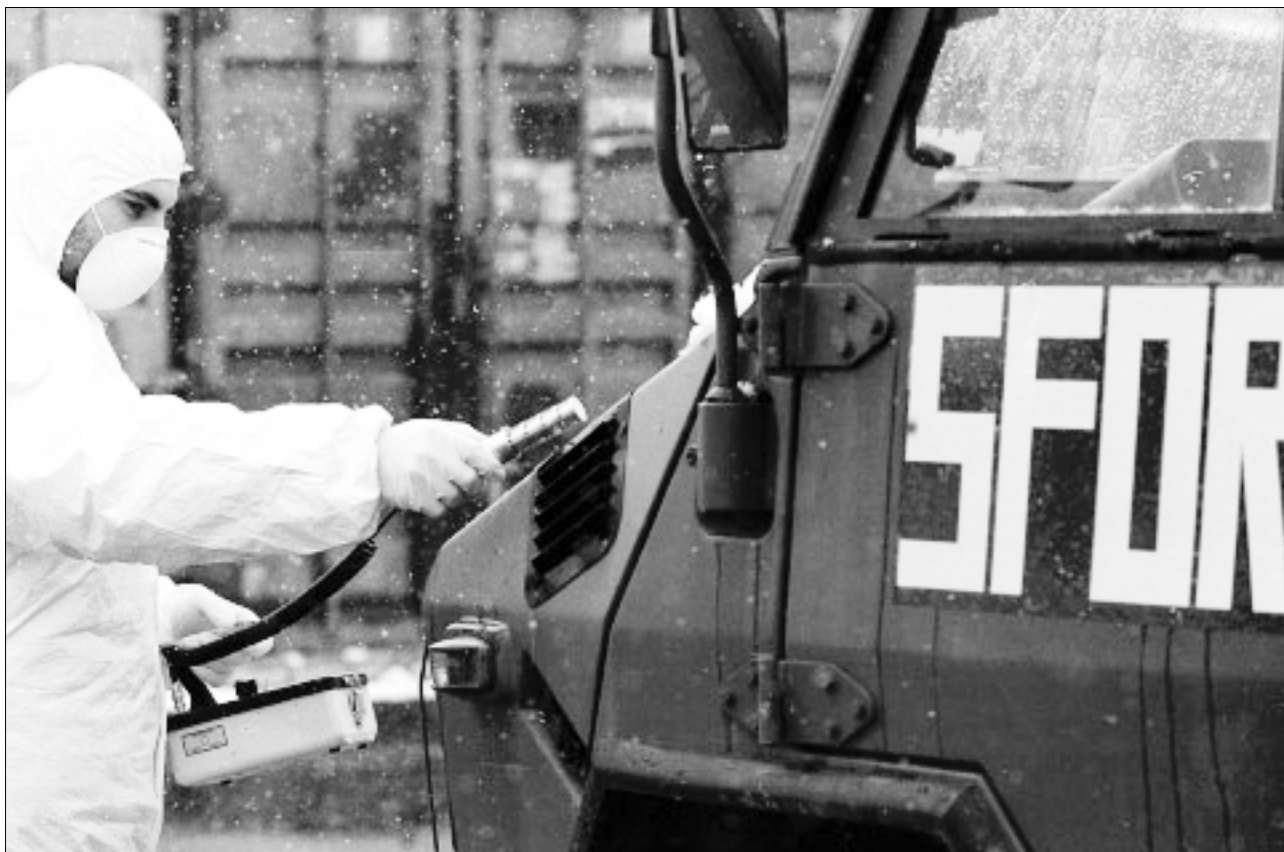
Un miembro de un equipo de expertos del ejército italiano mide los niveles de radiación en la principal base italiana de Sarajevo, Bosnia y Herzegovina, el 1 de febrero del 2001.