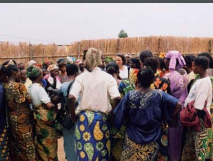
Des victimes de viol rencontrent une déléguée d'Amnesty International en mission en République démocratique du Congo, en mars 2004.

Les soldats qui violent les femmes s'emparent souvent aussi de toutes leurs possessions, jusqu'aux vêtements et à la batterie de cuisine.