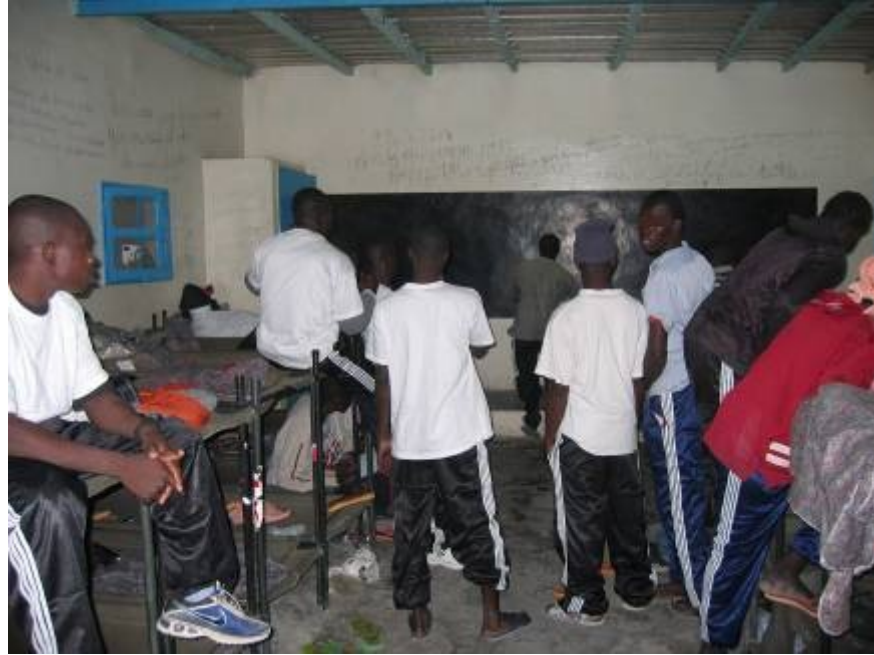
مهاجرون في مركز الاعتقال بنواذيبو

تشير المعلومات المثبتة إلى أن بعض أفراد قوات الأمن يجرون فعلاً اعتقالات تعسفية للمواطنين الأجانب، لاسيما مواطنو دول المجموعة الاقتصادية لغرب أفريقيا. وزعم أن هؤلاء الأشخاص، الذين قبض عليهم في الشوارع أو المنازل، بدون أي دليل كما يبدو، اتهموا بأنهم يعتزمون مغادرة موريتانيا بصورة غير نظامية للسفر إلى أوروبا. وقال بعض هؤلاء الأشخاص المحتجزين في مركز الاعتقال في نواذيبو بانتظار إعادتهم إلى مالي أو السنغال، لوفد منظمة العفو الدولية إنهم موجودون بصورة قانونية في موريتانيا وأنه في وقت اعتقالهم، مزقت قوات الأمن أذون الإقامة التي كانت بحوزتهم. وتخشي منظمة العفو الدولية من أن تكون هذه الاعتقالات التعسفية أحد الآثار السلبية للضغط الذي يمارسه الاتحاد الأوروبي على الحكومة الموريتانية.