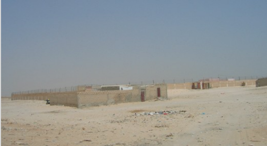
مركز نواذيبو للاعتقال

والمركز الذي لا يخضع لأية أنظمة تنطبق على مراكز الاعتقال الموريتانية لا يبدو أنه يحمل اسماً رسمياً أيضاً. وأبلغ المدير الإقليمي للأمن الوطني في نواذيبو منظمة العفو الدولية أن السلطات الموريتانية أشارت إليه "كمركز استقبال للمهاجرين السريين". وقال القنصل الأسباني في نواذيبو إن الأسبان أطلقوا على المركز اسم "مركز احتجاز أو اعتقال". والمهاجرون المحتجزون في المركز يشيرون إليه "بمركز الصليب الأحمر"، بينما يطلق عليه السكان الآخرون في نواذيبو وبعض المهاجرين اسم "غوانتاميتو". 24 وهذه الشكوك المحيطة باسم المركز تشكل مؤشراً آخر على غياب أي طابع قانوني لمركز الاعتقال هذا.