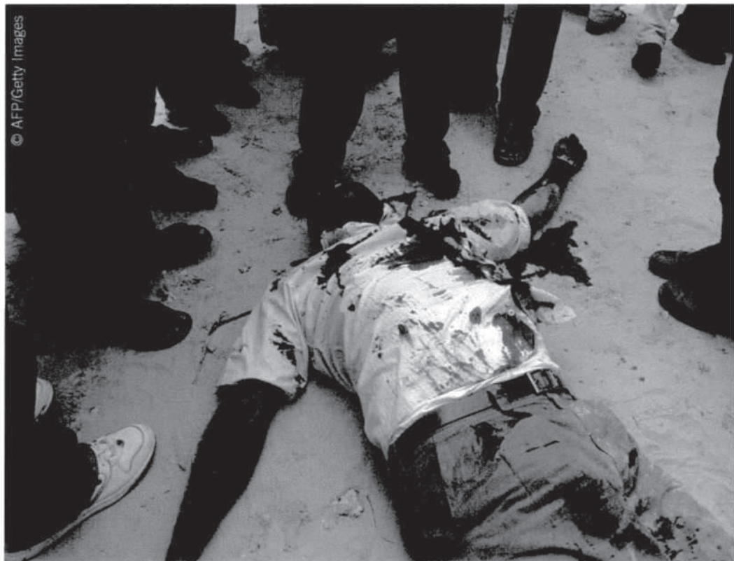
Le corps d'un journaliste somalien, Ali Iman Sharmarke, directeur du Réseau médias Hornafrik, tué lors d'un attentat à la voiture piégée à Mogadiscio, le 11 août 2007.

Ces restrictions ont été levées, le 4 décembre 2007, à la suite des très nombreuses protestations émises par les organisations des journalistes, d'autres