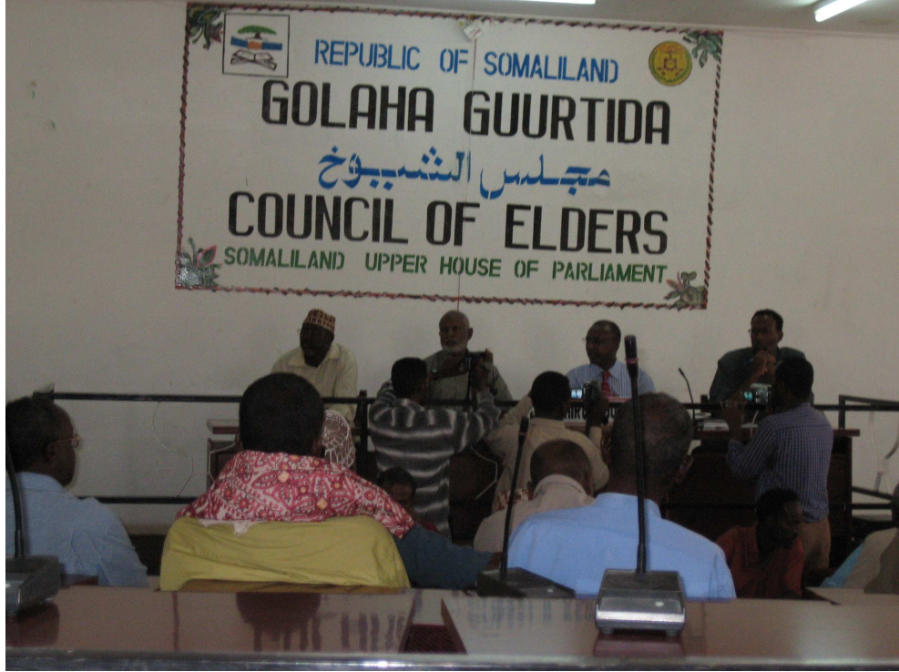
اجتماع مجلس الشيوخ (غورتي) في مايو/أيار 2007

واضحة. ويحدو منظمة العفو الدولية الأمل في أن اللجنة ستتطور بطريقة تمكّنها من العمل بشكل مستقل عن الهيئات الحكومية.