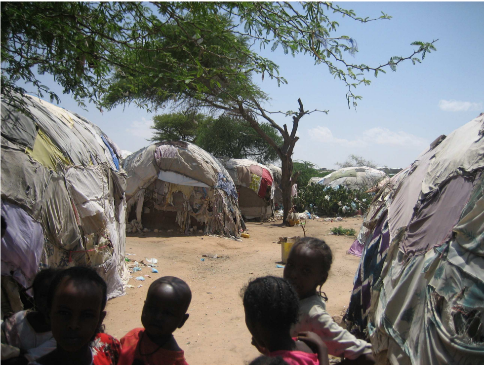
مخيم للأشخاص النازحين في أرض الصومال

وتقع على عاتق حكومة أرض الصومال المسؤولية الرئيسية عن حماية الأشخاص النازحين في أرض الصومال. وبموجب اتفاقية الأمم المتحدة الخاصة بوضع اللاجئين لعام 1951، يحق للاجئين أن يعاملوا على أفضل نحو ممكن، وليس بمستوى أقل من مستوى معاملة الأجانب عموماً في الظروف نفسها، فيما يتعلق بالسكن (المادة 21) والتعليم العام (المادة 22) والإغاثة العامة (المادة 23). وقد تعززت هذه الواجبات بالمبادئ التوجيهية العامة للجنة التنفيذية للمفوضية العليا لشؤون اللاجئين، التي تدعو الدول إلى اتخاذ خطوات لمنع أعمال العنف ضد اللاجئين، وضمان سلامتهم الجسدية، وتسهيل إمكانية حصولهم على الإنصاف القانوني الفعال. 19