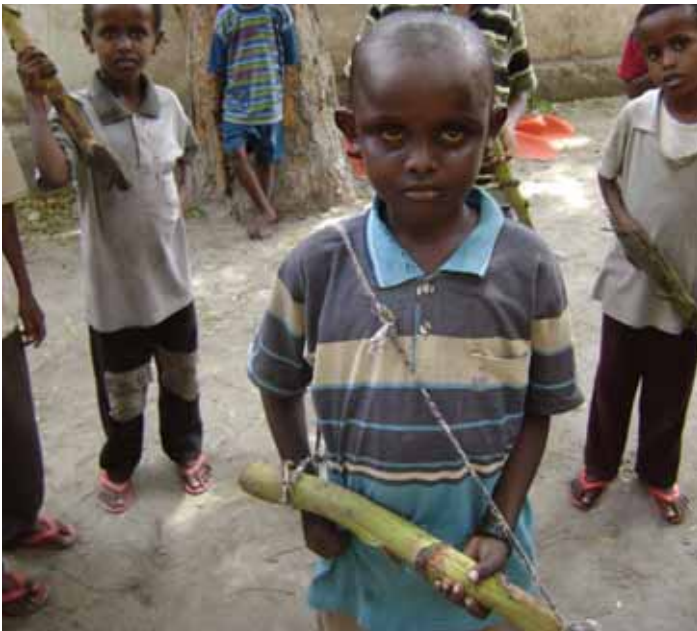
Enfants somaliens jouant à la guerre, Mogadiscio, août 2008