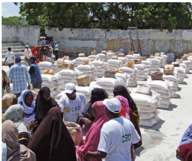
Distribution d'aide alimentaire par une organisation humanitaire somalienne à Madina, Mogadiscio, en mai 2007. Cette aide est maintenant menacée.

humanitaires car, pour assurer la protection de leur personnel et de leurs organisations partenaires, elles doivent évaluer dans quelle mesure ceux-ci risquent d'être pris pour cibles par des groupes d'opposition armés uniquement à cause de leur travail. Actuellement, rares sont les organisations humanitaires qui pensent que leurs employés sont visés seulement parce qu'ils fournissent de l'aide ou des services humanitaires d'urgence ; elles estiment donc pouvoir continuer d'apporter cette aide et ces services essentiels à la population du sud et du centre de la Somalie. Cependant, le nombre de travailleurs humanitaires tués ou attaqués en 2008 indique clairement que la nature de leur travail ne leur confère plus de protection.