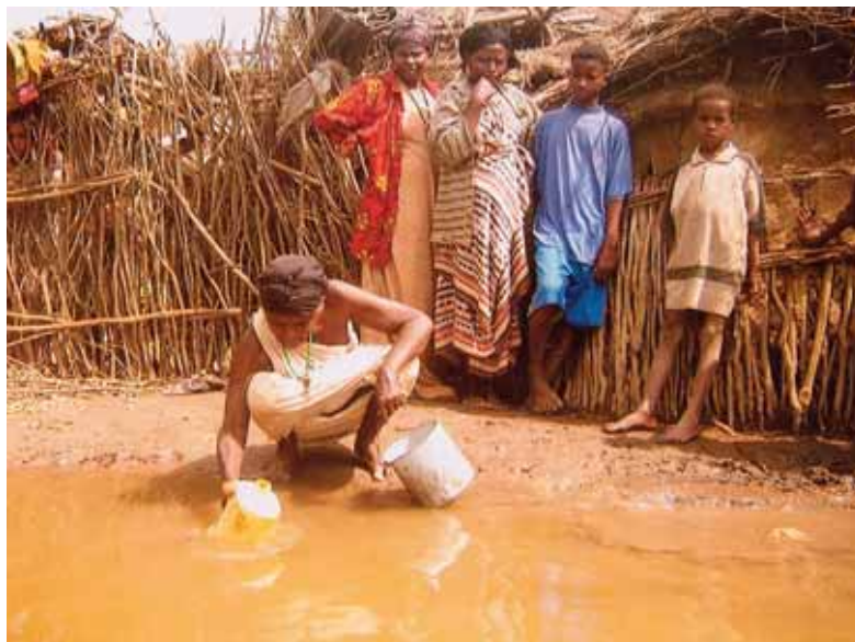
Point d'eau : les ressources locales ont été épuisées par les nombreuses personnes ayant fui Mogadiscio.

En outre, cette situation a fortement augmenté les coûts de distribution de l'aide humanitaire en Somalie. En effet, les menaces en matière de sécurité sur terre et en mer, les points de contrôle illégaux, les barrages et autres moyens utilisés par les autorités ou les groupes armés pour extorquer des fonds ont accru les frais d'acheminement des denrées alimentaires. En août 2008, les Nations unies signalaient au moins 325 barrages sur les routes de Somalie, la plupart tenus par la police du gouvernement fédéral ou par des milices claniques, qui demandaient presque tous le paiement d'un droit de passage ou de protection avant d'autoriser les véhicules humanitaires à