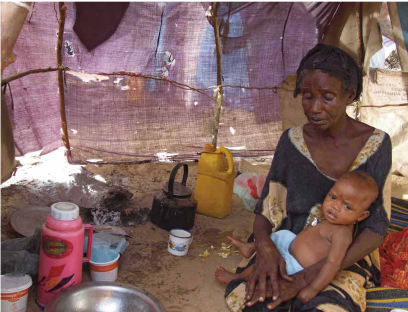
Une femme aveugle et sa petite-fille dans le camp pour personnes déplacées d'Elasha, avril 2008. Cette femme a dû fuir Baidoa en 1998, puis Mogadiscio en 2007.