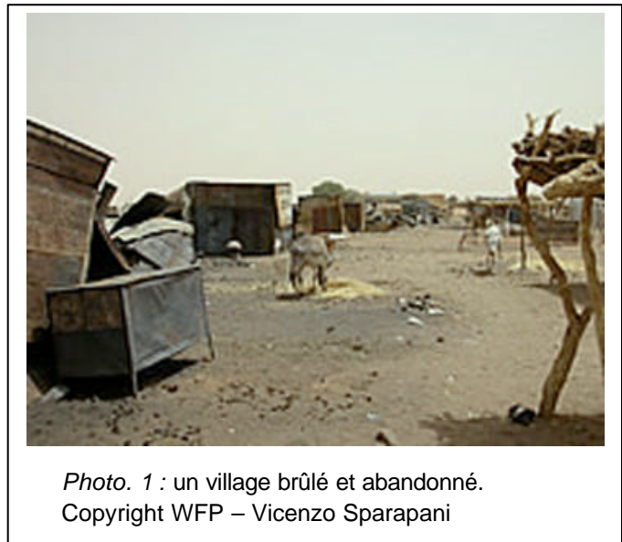
Photo. 1 : un village brûlé et abandonné.

L'analyse des images satellite demandée par Amnesty International révèle l'étendue des destructions de villages autour de Mornay, dans l'ouest du Darfour. Les photographies Landsat ont été recueillies le 30 mars 2003 et le 1 er mai 2004, puis comparées afin de mesurer les dévastations survenues entre ces deux dates