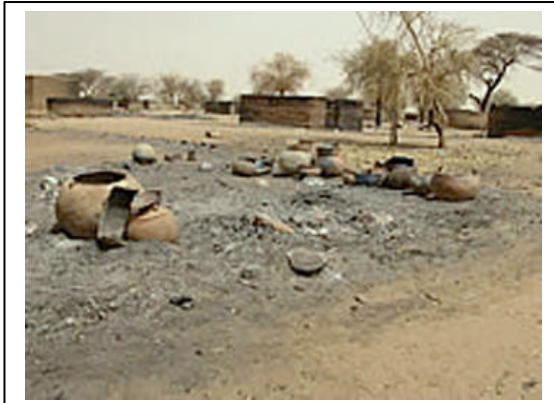
Photo. 3 : un village brûlé et abandonné.

d'un grand arbre couvre plusieurs générations). Le village de Murli, situé à cinq kilomètres d'al Jeneina, a été attaqué deux fois entre juillet et août 2003, ce qui s'est traduit par un massacre de civils. Des délégués d'Amnesty International ont recueilli le témoignage d'un des villageois, dans un camp de réfugiés au Tchad :