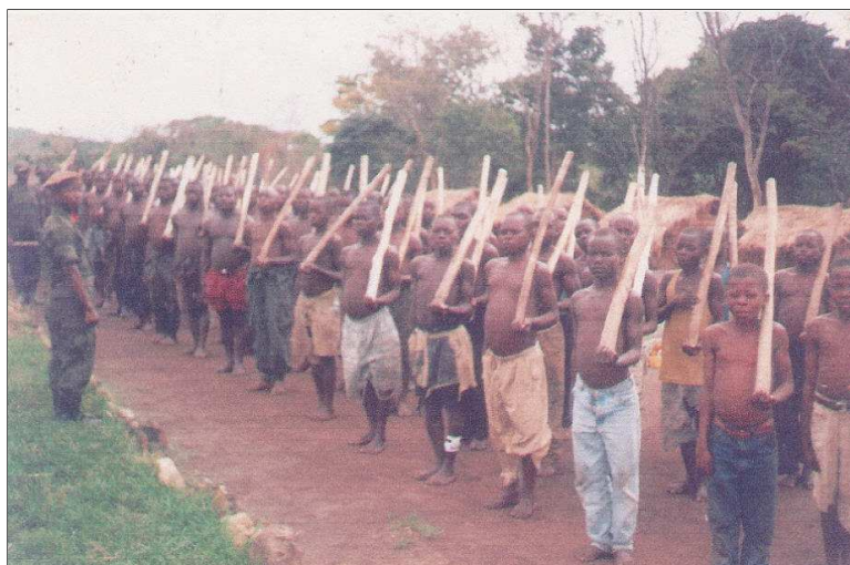
Enfants soldats en formation, auprès de l'UPDF semble-t-il, dans un camp militaire du RCD-MI à Nyaleke, Beni, en 1999.

Bien que des services de protection de l'enfance liés à la MONUC et à des ONG internationales et locales se soient efforcés de récupérer des enfants soldats, en bénéficiant parfois de la coopération des groupes politiques armés, de nombreux enfants soldats ainsi démobilisés sont ensuite « recyclés » dans les groupes politiques armés ou les milices locales des belligérants. Nombre d'enfants, ne disposant pas d'autres moyens de subsistance, s'enrôlent à nouveau, parfois sous la pression de chefs de guerre locaux. Un certain nombre d'enfants soldats compteraient parmi les victimes d'une attaque menée en juin 2002 par une milice RCD-ML et lendu sur un camp d'entraînement militaire de l'UPC à Mandro ; plusieurs civils hema auraient également été tués lors de cet assaut.