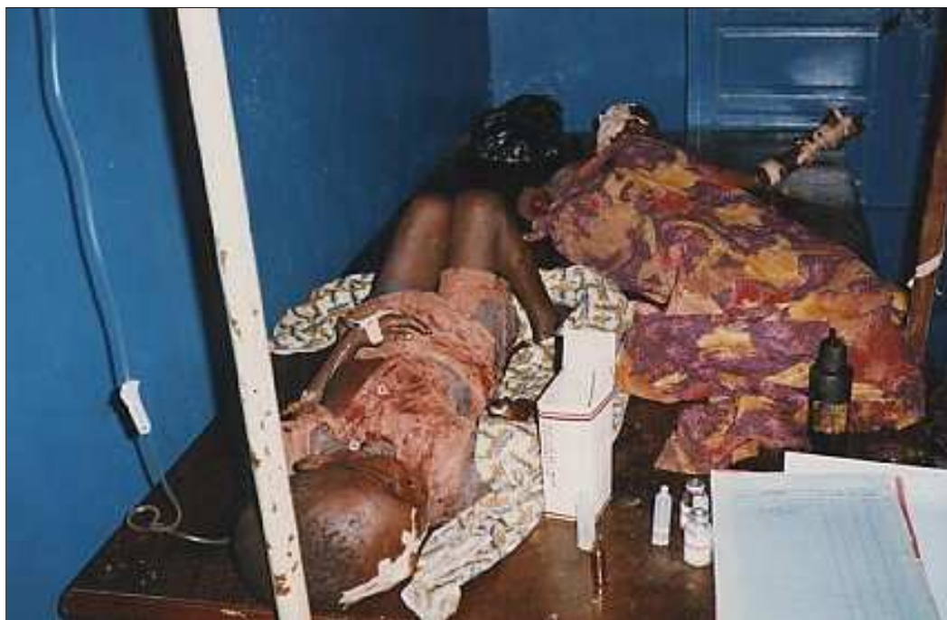
Des blessés civils lendu à l'hôpital de Rwankole, après avoir été attaqués par les milices hema ou les groupes civils d'autodéfense, Bunia, Janvier 2001.

Au cours de la première phase des combats, entre juin 1999 et le début de l'an 2000, qui était concentrée sur le territoire de Djugu, les milices hema, fréquemment soutenues par l'UPDF qui leur fournissait des armes à feu, ont rapidement eu le dessus. Les communautés lendu ont été chassées de leurs territoires traditionnels, en particulier le long des grandes routes menant à la frontière ougandaise. Toutefois, alors que le conflit se poursuivait, les Lendu ont bénéficié d'alliances avec d'autres communautés ethniques et groupes politiques armés. Les Hema comme les Lendu, aiguillonnés par leurs chefs qui les incitaient à la haine ethnique, ont adopté des positions de plus en plus extrémistes. La violence a été d'une brutalité exceptionnelle, marquée par des massacres à l'arme blanche – machettes, haches, lances, arcs et flèches –, la destruction systématique de villages par le feu et le déplacement de leurs habitants.