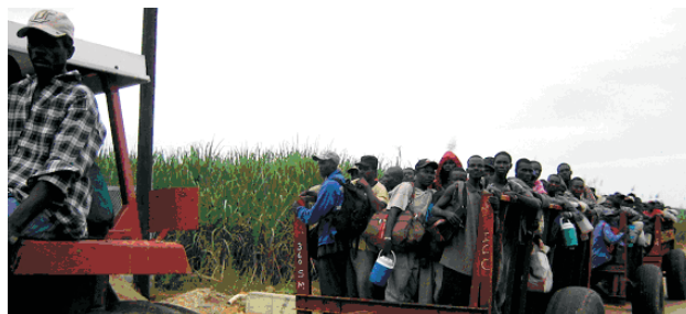
Trabajadores migrantes haitianos llegan para la zafra a una plantación de caña de azúcar en la provincia de San Pedro de Macorís.

Además de la expulsión, los hijos e hijas de haitianos encuentran obstáculos cuando intentan conseguir un certificado de nacimiento en el Registro Civil. Sin este documento (que es el que identifica a los menores), no pueden cursar más que estudios primarios. Tampoco pueden solicitar documento de identidad cuando llegan a los 18 años, lo cual los excluye del mercado de trabajo oficial y les impide votar. Los progenitores sin documentos no pueden inscribir en el registro a sus descendientes, y esto convierte a muchos miles de ellos en apátridas, perpetuándose así el círculo vicioso de privación de derechos.