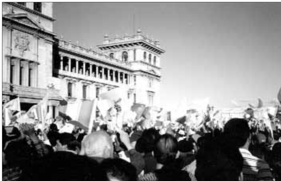
Una muchedumbre esperanzada se agolpa en la plaza central de Ciudad de Guatemala para celebrar la firma de los acuerdos de paz, 29 de diciembre de 1996.

El nuevo presidente también prometió que el asesinato del obispo Juan José Gerardi, cometido en 1998, se resolvería en los primeros seis meses de su gobierno. En la práctica, hubieron de transcurrir 17 meses desde la llegada al poder del presidente Portillo, y fueron necesarias amplias presiones internacionales, para que tres oficiales del ejército fueran finalmente condenados a la pena máxima de 30 años de prisión por la ejecución extrajudicial del obispo Gerardi. Se mantuvieron abiertos los procedimientos contra otros oficiales por su presunta implicación en este delito.