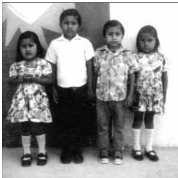
Niños víctimas de la masacre de Los Josefinos, El Petén, marzo de 1982.

A continuación describimos tres de los pocos casos en los que se ha realizado algún progreso en la identificación de los culpables. El camino de la justicia ha sido largo y difícil, y los que han participado en él han pagado un elevado precio.