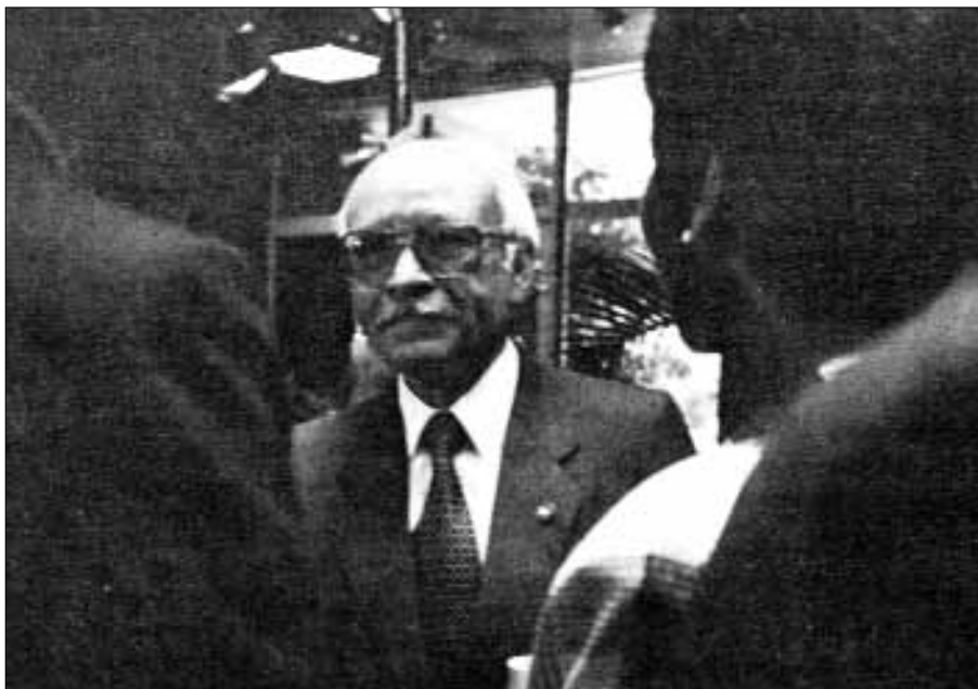
El presidente de la Corte de Constitucionalidad, Epaminondas González Dubón con una delegación de AI en 1993. Fue asesinado en abril de 1994, poco después de que emitiera el voto que decidió la extradición por narcotráfico a Estados Unidos de un oficial del ejército.

golpe». También había resuelto que el vicepresidente de Serrano, Gustavo Espina, no podía asumir el poder tras abandonar Jorge Serrano el país, ya que, al haber estado implicado en el «auto-golpe», constitucionalmente estaba inhabilitado para el cargo. A consecuencia de sus resoluciones, dos poderosos generales tuvieron que abandonar el ejército.