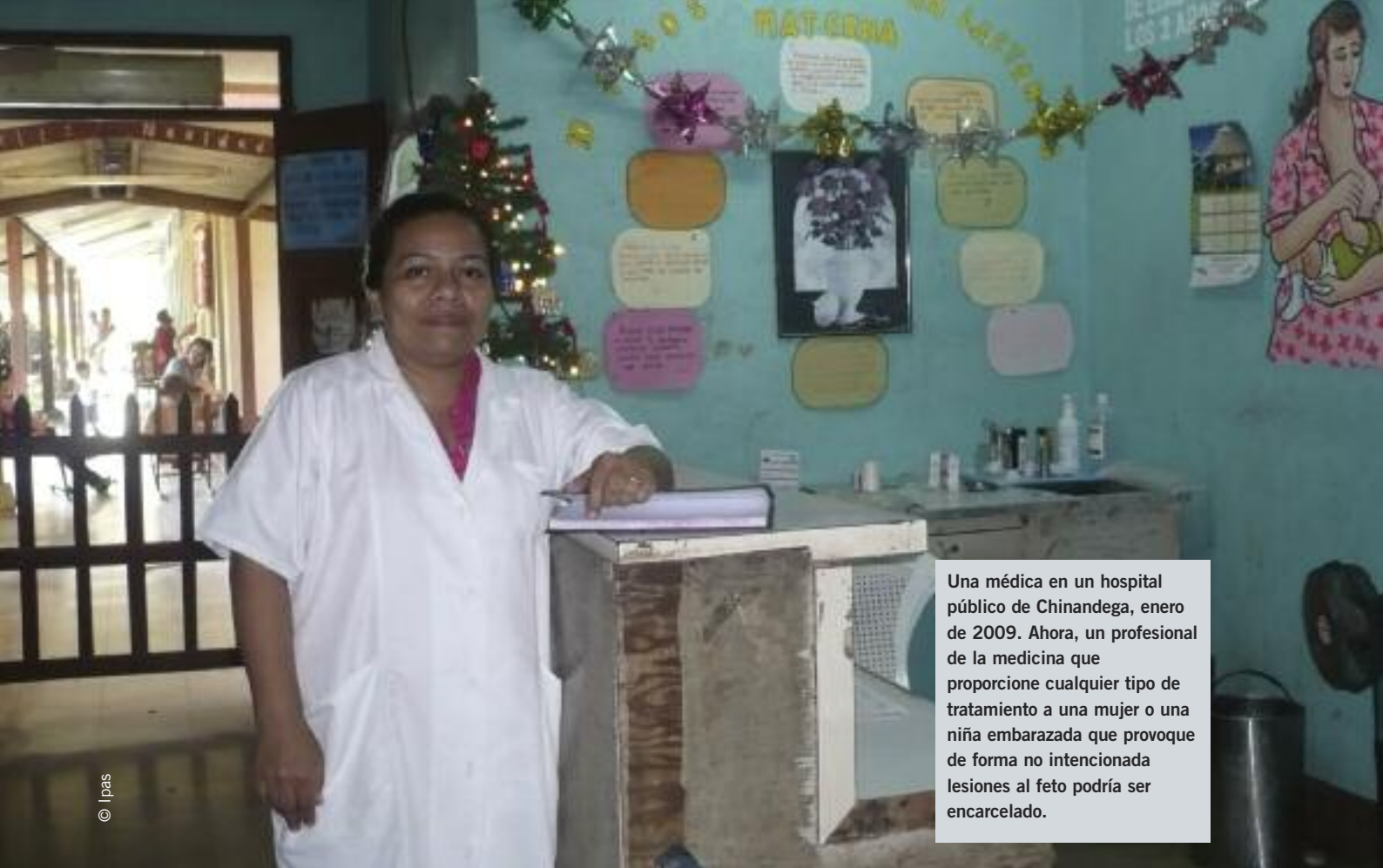
Una médica en un hospital público de Chinandega, enero de 2009. Ahora, un profesional de la medicina que proporcione cualquier tipo de tratamiento a una mujer o una niña embarazada que provoque de forma no intencionada lesiones al feto podría ser encarcelado.