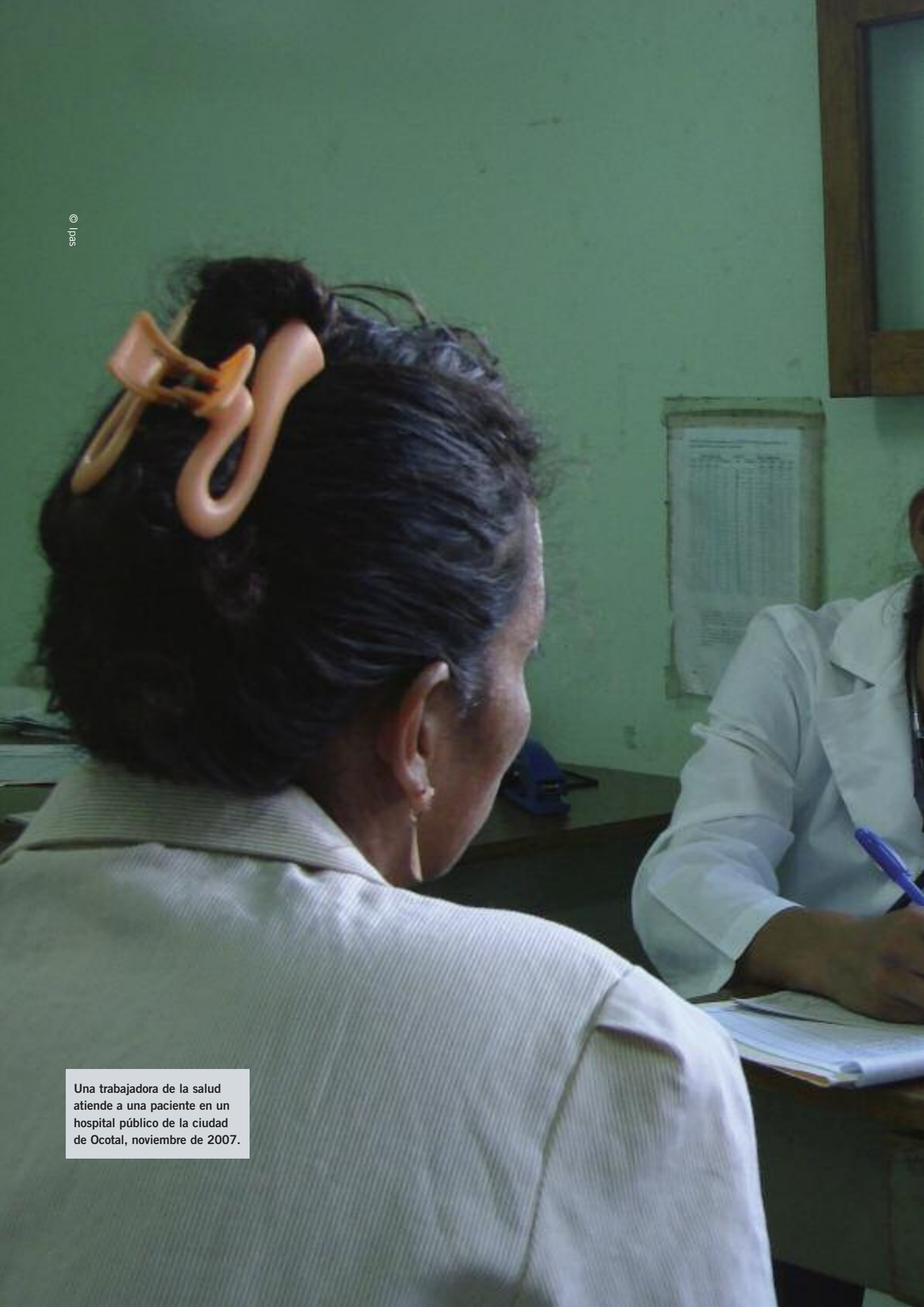
Una trabajadora de la salud atiende a una paciente en un hospital público de la ciudad de Ocotlán, noviembre de 2007.