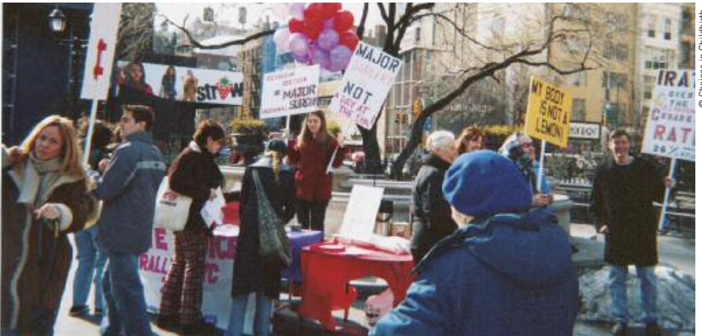
New York, 2004. Manifestation de femmes militant en faveur d'une réduction du nombre de césariennes, actuellement pratiquées dans près d'un accouchement sur trois aux États-Unis.