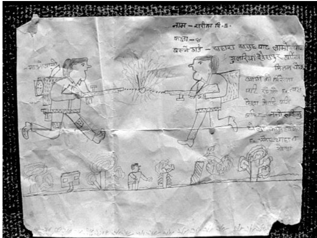
Combate entre el Partido Comunista de Nepal (Maoísta) y el Real Ejército Nepali, dibujado por un niño en el Sahara Children's Home, Nepalgunj.