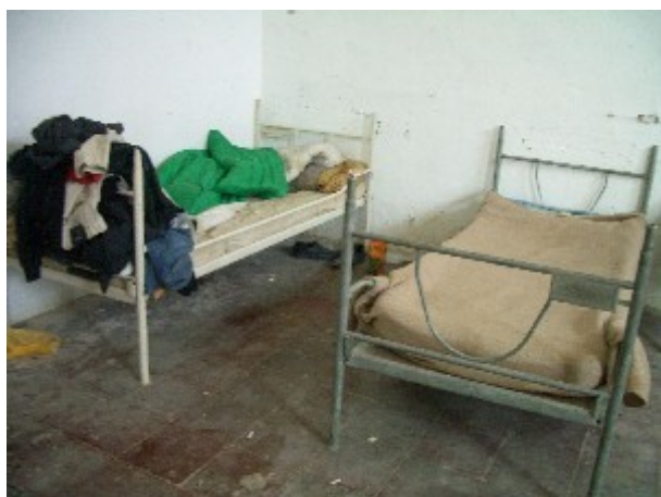
Tirana: habitación del antiguo konvikt de la Escuela de Hostelería y Turismo.

Éste es un centro educativo y no se puede utilizar para solucionar problemas de alojamiento. Sin embargo, hay que reconocer también que estas personas no disponen de medios, y no se las puede echar a la calle. El Estado debería solucionar sus problemas lo antes posible, pues están ocupando una gran cantidad de espacio que corresponde en realidad a los estudiantes [...] La Corporación Municipal [dice] que los ocupantes deberían rellenar los impresos de solicitud de viviendas [...] Tenemos entendido que el ayuntamiento no puede hacer otra cosa, pero la cumplimentación de las solicitudes lleva tiempo, y el problema hay que solucionarlo ya [...] El Departamento de Servicios Sociales nos dijo que alojáramos a las familias en otra residencia de forma temporal hasta que se terminaran las obras de la residencia de la Escuela de Hostelería y Turismo, y que después les permitiéramos seguir viviendo en ella hasta que se les encontrara un alojamiento adecuado. Pero eso no es justo. La residencia es una institución educativa, no un albergue. No es tarea del Departamento de Educación solucionar problemas de alojamiento. 72