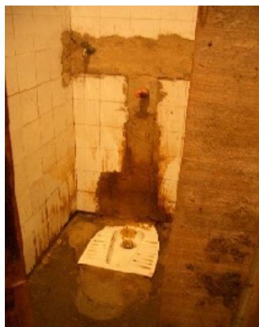
Tirana: Condiciones antihigiénicas en el antiguo konvikt de la Escuela de Hostelería y Turismo.