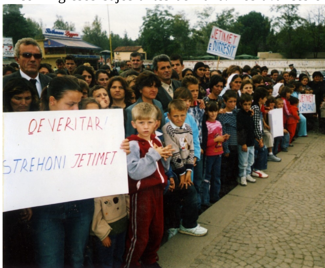
Manifestación en demanda de viviendas para huérfanos.

En este informe se analizan también la política en materia de vivienda y los planes actuales para la construcción de viviendas sociales. En 2005, el gobierno aprobó un plan en el que se prevé la construcción de 4.000 viviendas en todo el país para familias vulnerables y con ingresos bajos antes de 2010. Los avances en la aplicación de este plan han sido hasta