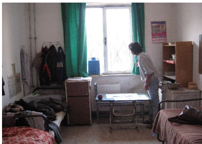
Konvikt de la Escuela de Música de Shkodër: mirando al futuro.

Varios municipios tienen programas adicionales de viviendas sociales. Por ejemplo, el Ayuntamiento de Tirana, en donde hay registradas unas 3.000 familias sin hogar, ha anunciado planes para la construcción de 680 viviendas. 86 Sin embargo, la modalidad de vivienda en alquiler encuentra al parecer una cierta resistencia entre los posibles beneficiarios. Según los informes, la gran mayoría de los solicitantes han mostrado su preferencia por la adquisición de un piso con la ayuda de créditos subvencionados, a pesar de que pocos ganan lo suficiente para que les concedan uno. 87 Aunque por su volumen las inversiones en viviendas sociales no generan expectativas de que se vayan a satisfacer pronto las necesidades en materia de alojamiento de los sectores más pobres y vulnerables de la sociedad albanesa, constituyen un reflejo del reconocimiento de que no se pueden seguir desconociendo estas necesidades. Queda por ver en qué medida se hará realidad el derecho jurídico de los huérfanos adultos a disfrutar de preferencia en el acceso a una vivienda, es decir, “el derecho a vivir en seguridad, paz y dignidad en alguna parte”.