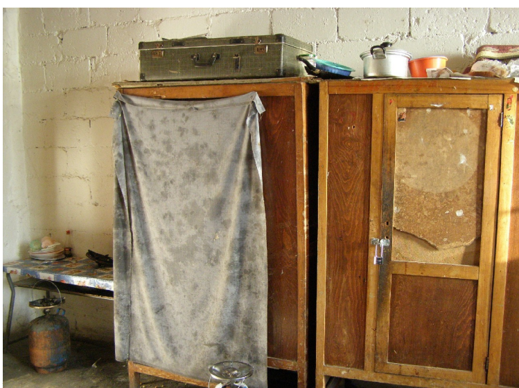
Vlora: estado del antiguo konvikt de la Escuela de Comercio, en el que ahora viven huérfanos adultos.