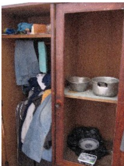
Shkodër: efectos personales en el konvikt de la Escuela Industrial.

oportunidades. Cuando se le da a alguien una vivienda, se le obliga a hacer algo para ganarse la vida. Muchas ONG extranjeras se han mostrado dispuestas a facilitar distintos tipos de formación [a los huérfanos adultos], pero la mayoría no quiere porque no les pagan durante los cursillos. Prefieren hacer cualquier trabajillo y ganar unos pocos leks a invertir su tiempo en formación”.