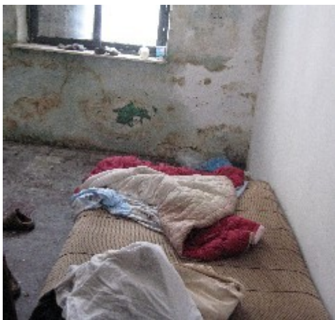
Tirana: cuarto del antiguo konvikt de la Escuela de Hostelería y Turismo.

En opinión de Amnistía Internacional, la situación en la que viven los huérfanos adultos alojados en residencias estudiantiles constituye un grave incumplimiento de varios de estos criterios, en especial los de asequibilidad, habitabilidad, gastos soportables y seguridad de tenencia. En primer lugar no se cumple el requisito de asequibilidad establecido por el Comité: “La vivienda adecuada debe ser asequible a los que tengan derecho. Debe concederse a los grupos en situación de desventaja un acceso pleno y sostenible a los recursos adecuados para conseguir una vivienda.” 63