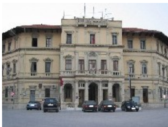
Ayuntamiento de Vlora.