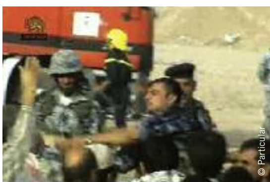
La policía y las fuerzas de seguridad iraquíes se enfrentan a residentes del campo de Ashraf, julio de 2009.

38 por ciento de ellas se sentían seguras “sólo parte del tiempo”. Además, al 34 por ciento les habían destruido total o parcialmente sus hogares. Otros problemas importantes de las personas que habían regresado eran la inseguridad alimentaria, la falta de agua y electricidad y el desempleo.