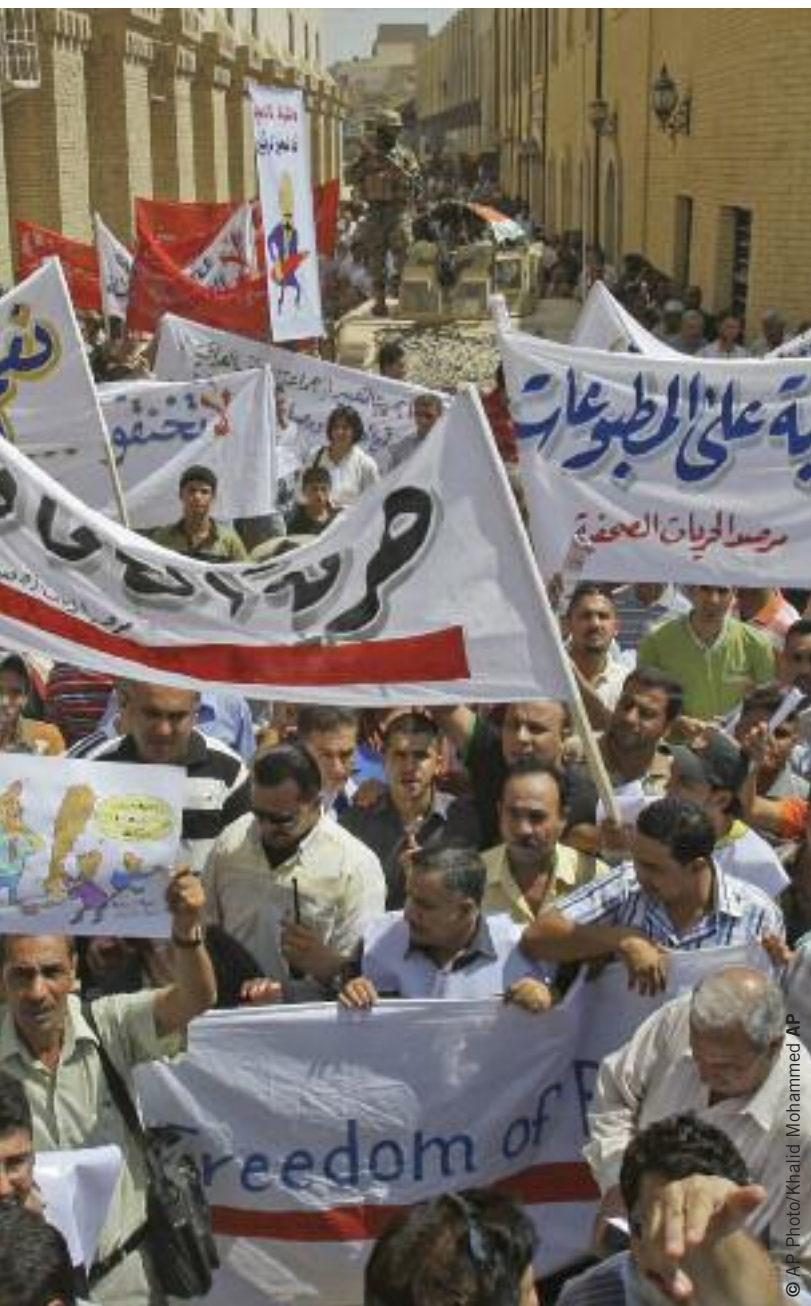
Manifestación en Bagdad por la libertad de prensa, agosto de 2009.