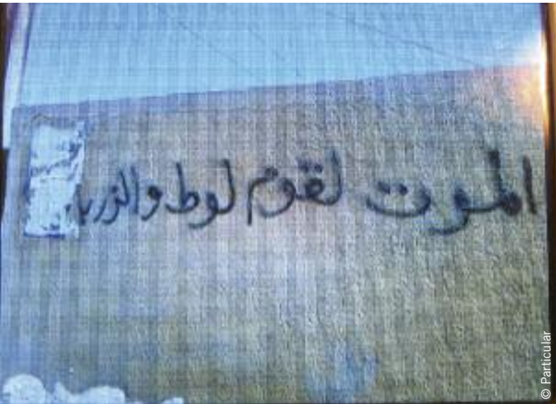
Pintada de Kufa, gobernación de Nayaf, fotografiada con un teléfono móvil en abril de 2009. Reza: “Muerte a los gays y a la gente sucia”.

Código Penal como justificación para reducir drásticamente la pena a los acusados de haber agredido o incluso matado a hombres homosexuales emparentados con ellos si afirman que lo hicieron para “lavar la vergüenza”. En sus sentencias, el Tribunal de Casación iraquí ha confirmado que el homicidio de un familiar sospechoso de conducta homosexual se considera delito cometido por “motivos de honor”, por lo que puede reducirse la pena en aplicación del artículo 128. 16