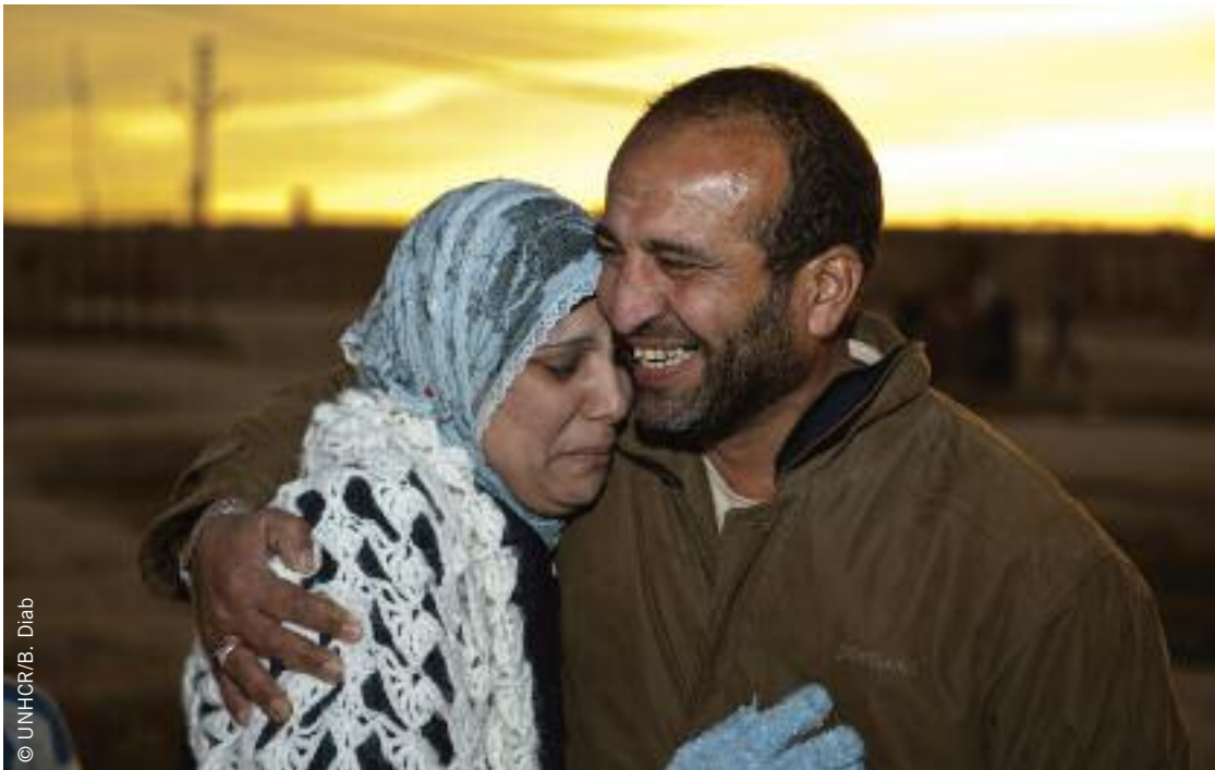
Una mujer que vivía en el campo de refugiados de Al Tanf, cerrado en febrero de 2010, se reúne con su hermano en el campo de Al Hol, en el norte de Siria. Los hermanos no se veían desde 2006.