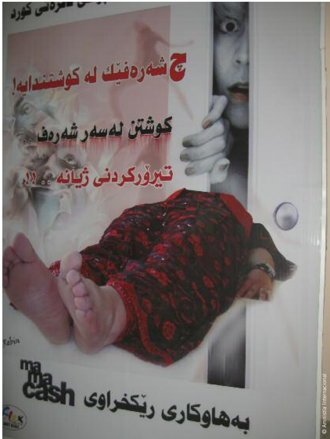
Cartel de la organización kurda de mujeres Khatuzeen haciendo campaña contra los homicidios en nombre del "honor".