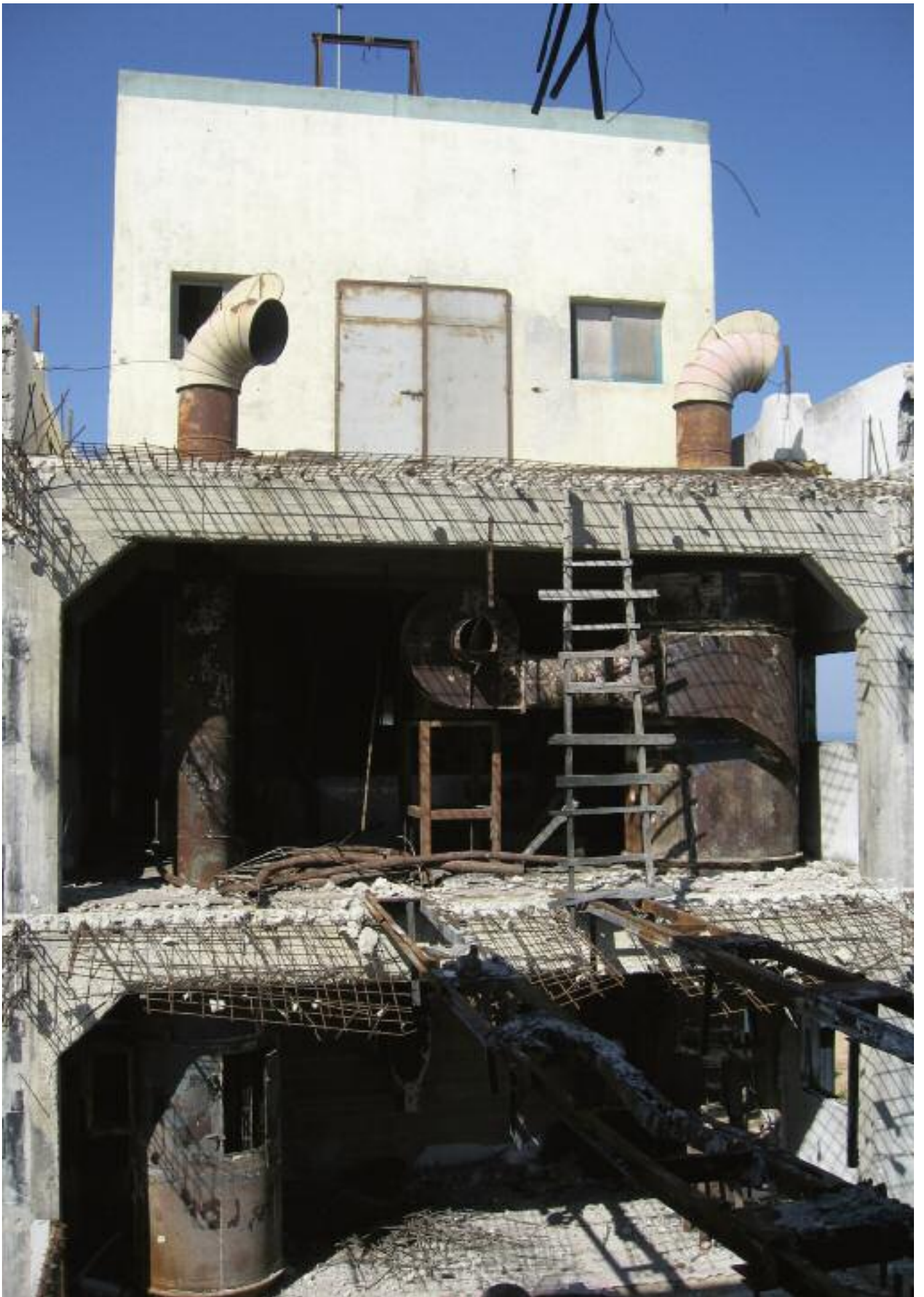
La minoterie Bader, touchée par les bombardements israéliens pendant l'opération « Plomb durci ».