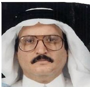
Dr Matrouk al-Falih

La falta de puntualidad y de frecuencia de los informes de Arabia Saudí a los órganos de vigilancia de otros tratados de derechos humanos, y la poca atención prestada a estos derechos en sus informes al Comité contra el Terrorismo son especialmente lamentables, ya que la Asamblea General de la ONU ha subrayado que “el respeto de los derechos humanos para todos y el imperio de la ley” es “la base fundamental de la lucha contra el terrorismo” y “esenciales de todos los componentes” de la Estrategia global de las Naciones Unidas contra el terrorismo. 26