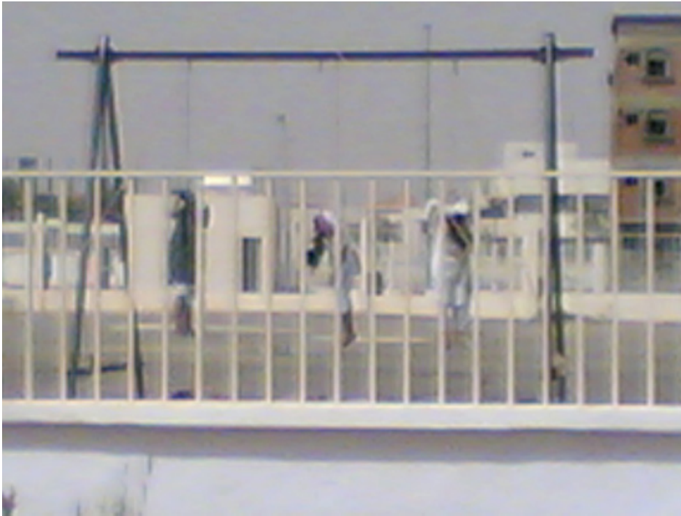
Foto facilitada por un contacto que confirmó que en ella aparecen los cadáveres de tres hombres ejecutados y crucificados en Al Jouf el 1 de abril de 2005.

En noviembre de 2004, el Ministerio del Interior anunció que se iba a juzgar a cuatro hombres a los que se había detenido en 2003, acusados de cometer unos homicidios políticos en Al Jouf, en el norte de Arabia Saudí. No se volvió a tener ninguna noticia hasta el 1 de abril de 2005, cuando se mostraron en público los cadáveres de tres de los cuatro hombres, a los que se había crucificado después de ejecutarlos. No se sabe prácticamente nada del juicio al que se los sometió. Al cuarto acusado le impusieron una pena de cárcel.