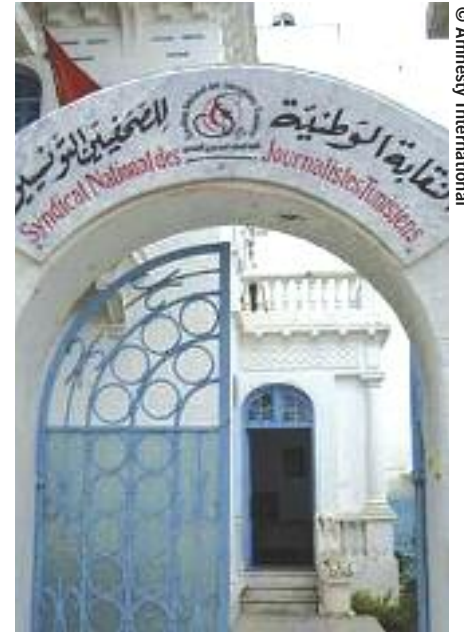
Entrée de l'immeuble qui abrite le Syndicat national des journalistes tunisiens (SNJT).

Les autorités considèrent depuis longtemps l'UGET comme une organisation « peu recommandable » qui doit être mise au pas. Ces dernières années, elles ont intensifié leurs efforts pour affaiblir l'UGET considérée comme prenant des positions politiques en ayant recours à différentes méthodes, notamment le harcèlement des membres actifs et de leurs proches, les poursuites sur la base d'accusations diverses, l'exclusion