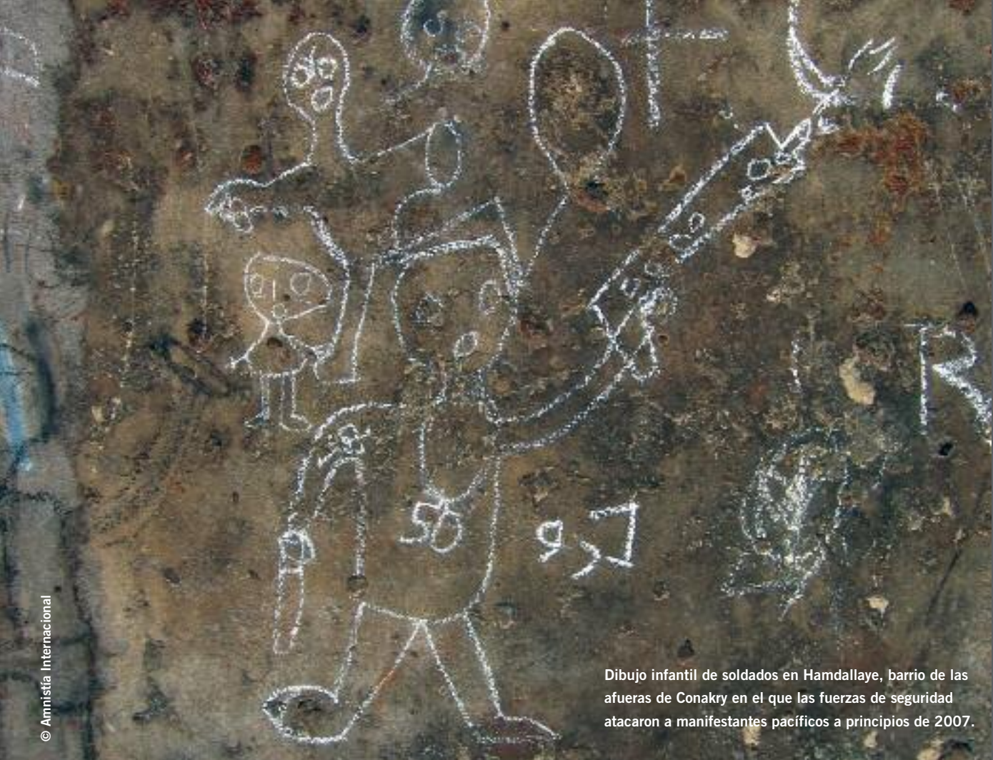
Dibujo infantil de soldados en Hamdallaye, barrio de las afueras de Conakry en el que las fuerzas de seguridad atacaron a manifestantes pacíficos a principios de 2007.