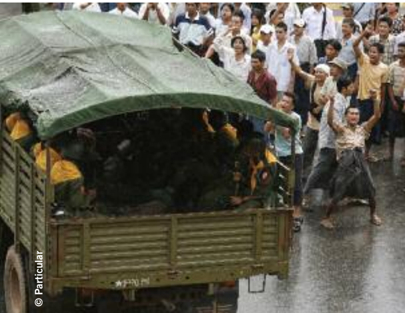
Fuerzas de seguridad llegan a una manifestación en el centro de Yangón, septiembre de 2007.