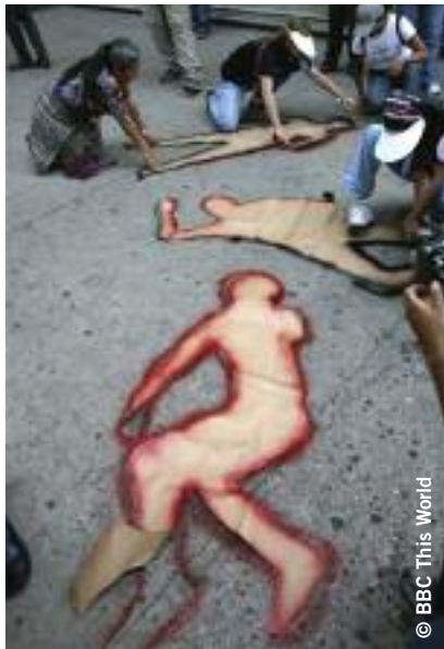
Protesta de mujeres por el alto índice de asesinatos de mujeres en Guatemala y por la falta de acción del Estado, noviembre de 2005.