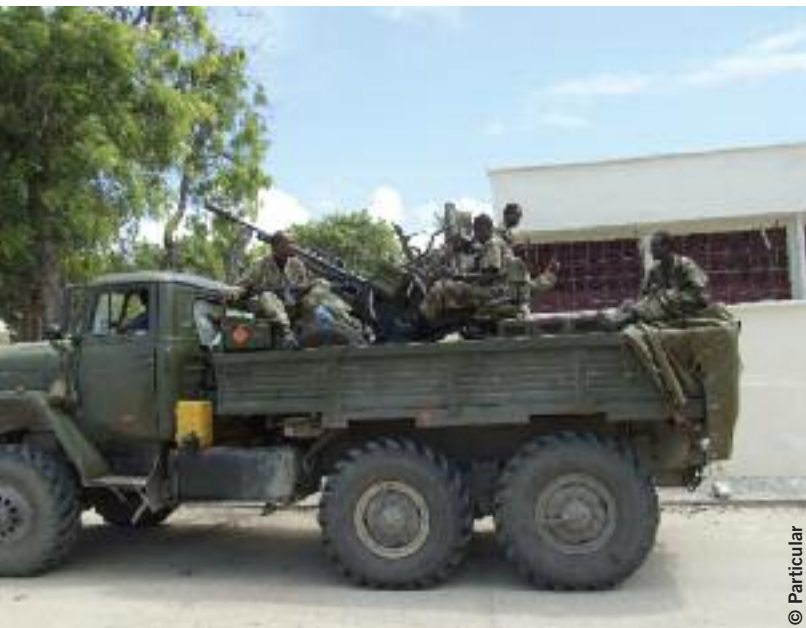
Soldados armados etíopes en un “técnico” en Mogadiscio, mayo de 2007.

“Cuando terminó el interrogatorio, a nueve de los hombres los llevaron y los metieron en un camión. Creo que se los llevaron a Etiopía. Creo que fue porque dos de ellos eran mulás que llevaban largas barbas [...] Los restantes 32, entre los que estaba yo, corrimos, nos escapamos, pero 11 murieron, los mataron a tiros. Pude ver cómo caían porque iban huyendo delante de mí, era el primer grupo. Ése fue el día en que decidí abandonar el país. Después, el 22 de noviembre, vi cinco cadáveres degollados. Dos de ellos, decapitados. La zona estaba ocupada por etíopes.”