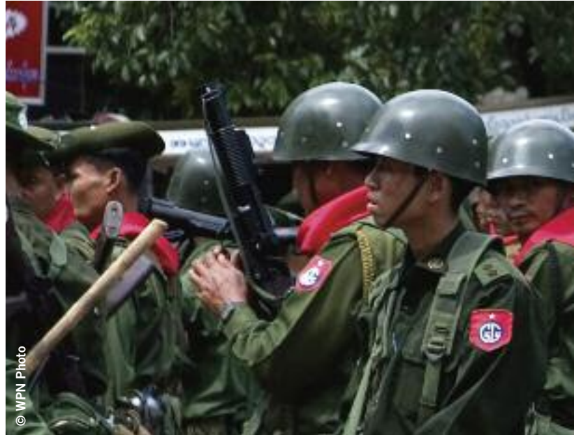
Lanzagranadas utilizados por las fuerzas de seguridad de Myanmar durante las manifestaciones de Yangón, 28 de septiembre de 2007.

Para proteger adecuadamente los derechos humanos, el TCA deberá abarcar armas militares, de seguridad y de actuación policial y todo tipo de material relacionado. No debe limitarse únicamente a las ocho categorías propuestas por algunos Estados (las siete categorías de vehículos, artillería y misiles incluidas en el Registro de Armas Convencionales de la ONU, más las armas pequeñas y las armas ligeras). Por ejemplo, los vehículos militares utilitarios y de transporte, que no están incluidos en el Registro de la ONU, se usan mucho en operaciones militares y de seguridad interna. Durante la represión de Myanmar, las fuerzas de seguridad emplearon camiones militares claramente de fabricación china –de los cuales varios