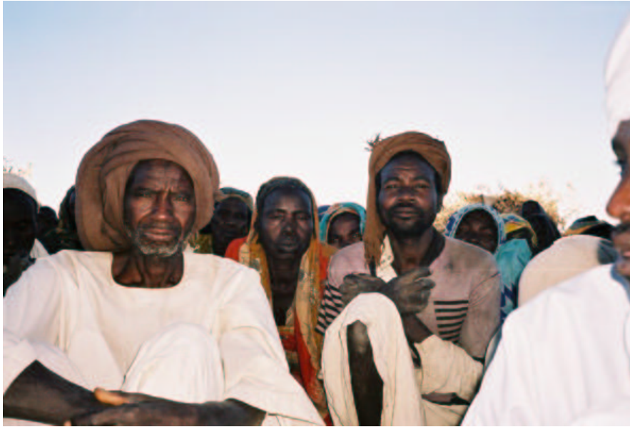
Un groupe de réfugiés Masalit que les délégués d'Amnesty International ont rencontré autour d'Adré à l'est du Tchad

Le village de Murli, à environ cinq kilomètres d'Al-Jeneina, a été attaqué deux fois entre juillet et août. Un villageois a déclaré aux délégués d'Amnesty International :