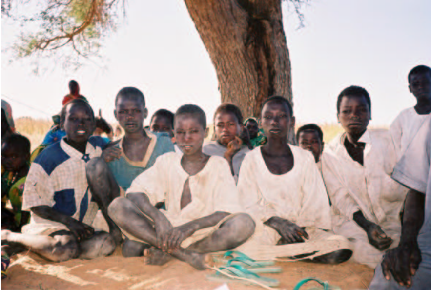
Groupe de garçons réfugiés autour d'Adré

Beaucoup de réfugiés ont aussi souligné les difficultés auxquelles leurs enfants faisaient face, et surtout le manque de facilités pour leur éducation.