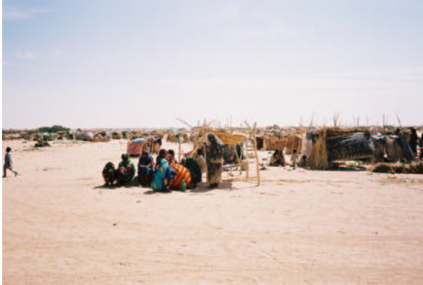
Abris de réfugiés faits de bric et de broc

Birak, et Adré, Birkengi, Nakuluta, Kolkol et Agan. A Tina 1, les réfugiés vivaient dans des abris faits de tissus et de bâtons trouvés aux alentours. A d'autres endroits, ils vivaient dans des abris précaires faits de branches sèches qu'ils avaient pu trouver dans cette région semi désertique.