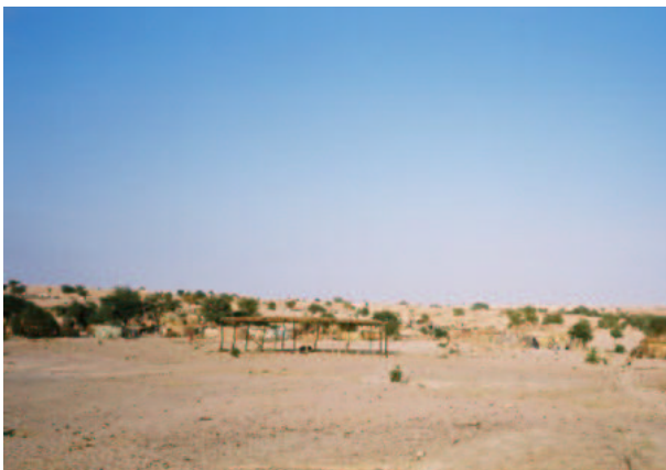
Une grande hutte construite par les réfugiés à Tine 2 pour servir d'école à leurs enfants

A Tina 2, les réfugiés ont montré aux délégués d'Amnesty International une grande hutte qu'ils avaient construite pour servir d'école à leurs enfants. Ils s'inquiétaient du fait que leurs enfants n'aient pu aller à l'école pendant des mois à cause du conflit au Darfour. Cependant, ils ont dit que les autorités locales étaient peu disposées à aider à l'éducation de leurs enfants, apparemment parce que les systèmes éducatifs au Soudan et au Tchad sont différents. Dans les camps autour d'Adré, les parents et les étudiants qui ont fui au Tchad ont aussi exprimé leurs préoccupations face à l'absence d'éducation auxquels ils faisaient face. Ils ont aussi souligné qu'ils considéraient la provision d'éducation pour les enfants et les étudiants comme prioritaire.