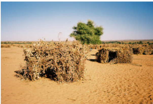
Abris de réfugiés faits de branches sèches à Adré

Au moment de la mission sur le terrain d'Amnesty International en novembre 2003, de l'aide n'avait été distribuée par le HCR qu'aux réfugiés les plus vulnérables et accessibles. Beaucoup souffraient de faim et de soif. Les délégués d'Amnesty International ont vu comment les réfugiés devaient creuser profondément le sable pour trouver de l'eau boueuse. La plupart des réfugiés sont arrivés au Tchad avec seulement les habits qu'ils portaient lorsqu'ils ont fui. Les conditions climatiques extrêmes se traduisent par de la chaleur pendant la journée et du froid la nuit. De plus, les réfugiés sont arrivés dans des endroits qui manquent de toilettes et d'équipements sanitaires. La pauvre infrastructure médicale dans les régions frontalières du Tchad, même avec l'établissement de centres et de facilités par l'organisation Médecins Sans Frontières (MSF), complique encore plus la situation. En décembre 2003, quelque 20 000 nouveaux réfugiés seraient arrivés au Tchad. Le 23 janvier 2004, 18 000 nouveaux réfugiés auraient traversé la frontière 18 .