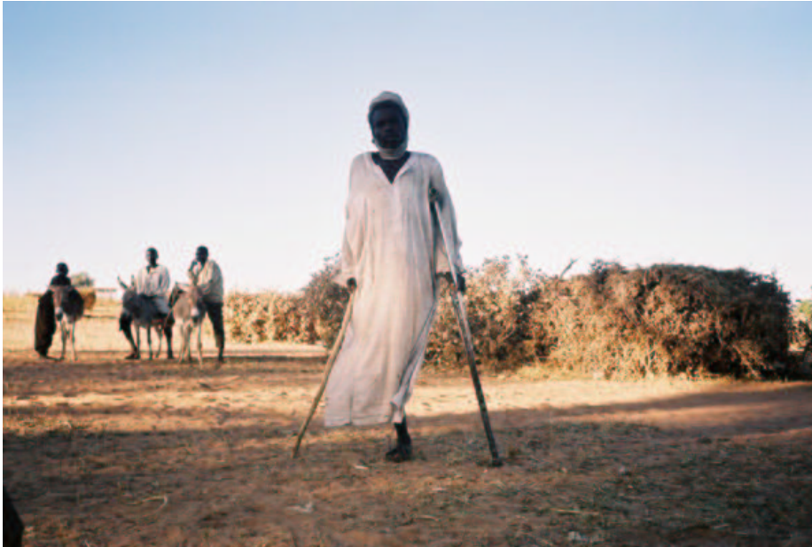
Un réfugié soudanais handicapé qui a fui l'attaque de son village au Darfour

Des civils ayant fui au Tchad ont été victimes d'attaques de Janjawid ayant traversé la frontière, au cours desquelles des personnes ont été tuées et du bétail volé.