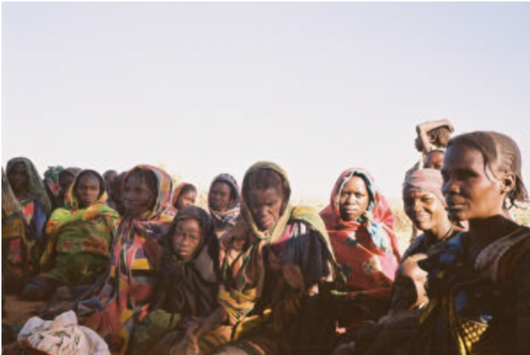
Un groupe de femmes originaires du Darfour qu'Amnesty International a rencontrées au Tchad

Les délégués d'Amnesty International ont entendu des récits indiquant le viol de femmes et de fillettes par les Janjawid. Il est cependant difficile de savoir à quelle échelle le viol est pratiqué dans le cadre de la guerre au Darfour, parce que les femmes n'en parlent qu'à contrecoeur, par peur d'être ostracisées par leur communauté. Comme les femmes l'ont dit aux délégués d'Amnesty International :