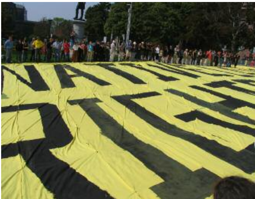
Izquierda: Acción de protesta de arte aéreo en favor de los derechos a la tierra de los pueblos indígenas, celebrada a las puertas de la asamblea legislativa de la provincia de Ontario, en septiembre de 2007.