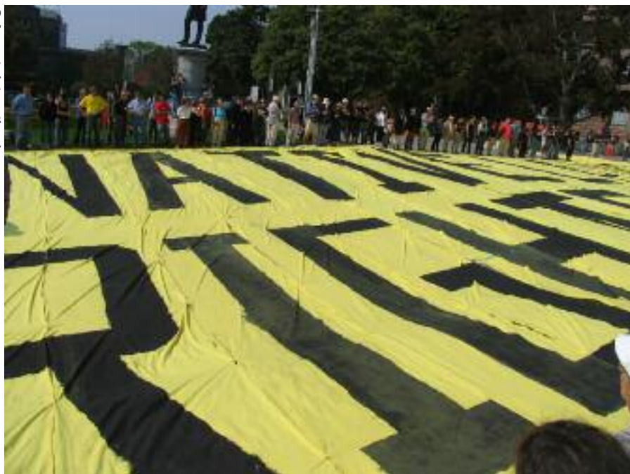
Photo de gauche : Banderole destinée à être vue du ciel, lors d'une manifestation en faveur du droit des autochtones à la terre, devant l'Assemblée législative provinciale d'Ontario, en septembre 2007.