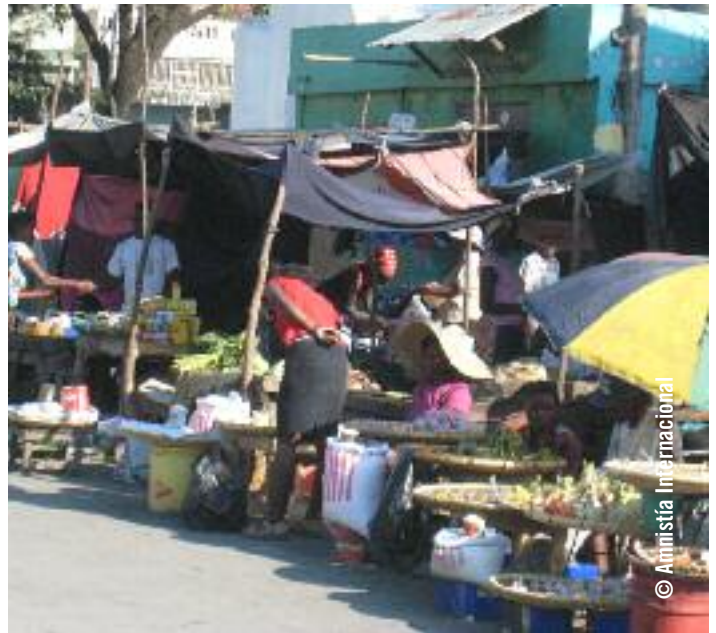
Con los elevados índices de desempleo, la venta callejera es una de las estrategias que muchas mujeres adoptan para sobrevivir a la penuria, Puerto Príncipe, Haití.

Entre las medidas que Haití debe adoptar para cumplir con la norma de la diligencia debida se encuentran las siguientes: promulgar legislación contra diversas formas de violencia de género y penalizarlas; formar al personal del Estado, aplicando mecanismos y políticas prácticas para proteger los derechos de las mujeres y las niñas; y