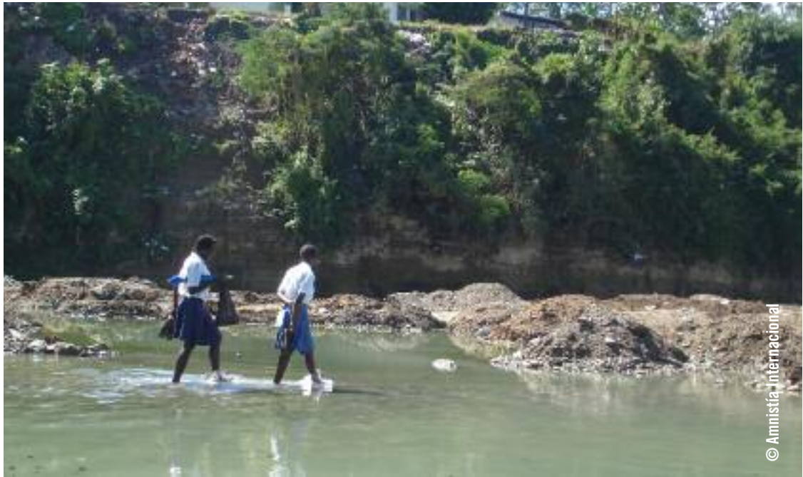
Niñas cruzando un río de camino a la escuela, Lavanneau, Haití.

El estudio concluye que, pese a los esfuerzos de las organizaciones de mujeres, no existe una “política de documentar las situaciones de violencia que permitiría conocer las dimensiones del problema [...] De hecho, no es posible saber, a nivel nacional ni regional, cuántas mujeres han presentado denuncias de violencia, cuál ha sido el resultado de esas denuncias y cuál es la situación actual de la víctima”. 21 En sus recomendaciones al gobierno, el estudio subraya la necesidad de contar con un mecanismo único y unificado para recopilar y analizar información sobre la violencia contra las mujeres. Desde que se llevó a cabo el estudio, se ha elaborado un formulario único para que lo utilicen todas las instituciones que estén en contacto con niñas y mujeres que han sufrido violencia sexual. Sin embargo, en el momento de redactar este informe, la aplicación de esta medida estaba en una fase muy inicial