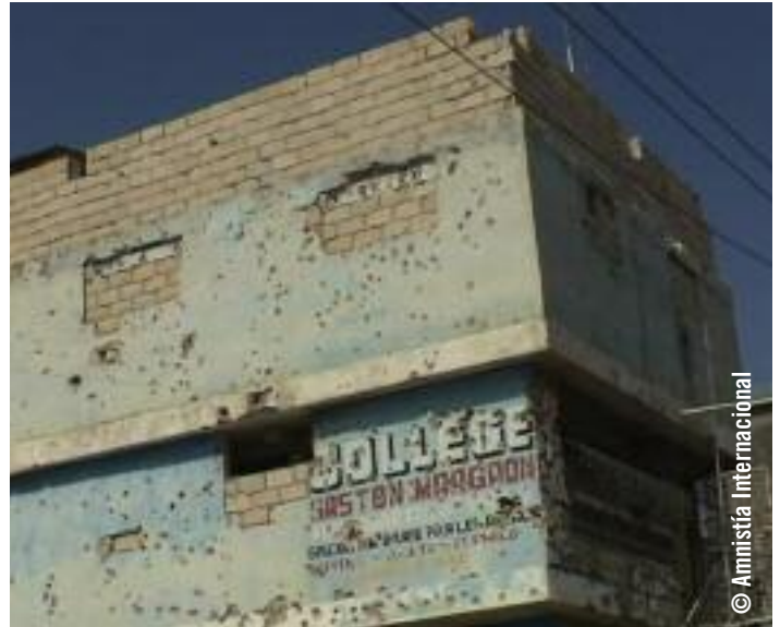
Paredes acribilladas a balazos de un colegio de Puerto Príncipe dañado durante los fuertes combates producidos en la zona entre bandas armadas y MINUSTAH en 2006.

Durante su visita a Haití en 1999, Radhika Coomaraswamy, relatora especial de la ONU sobre la violencia contra la mujer, sus causas y consecuencias, concluyó que “tras el golpe de Estado militar, las mujeres haitianas siguen padeciendo lo que algunos interlocutores han denominado ‘violencia estructural’, que se concentra en los sectores más vulnerables y pobres”. 6 La relatora también informó de que, entre noviembre de 1994 y junio de 1999, Ministerio de Asuntos y Derechos de la Mujer registró 1.500 casos de