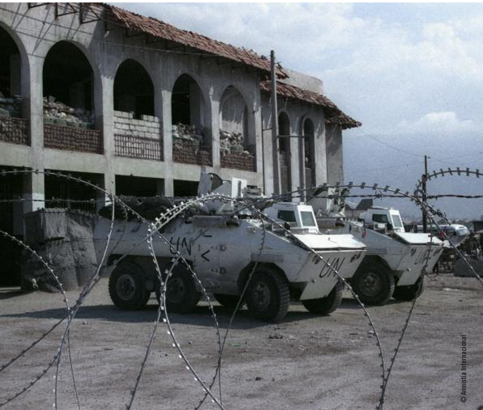
Base de la ONU a la entrada de la zona de Cité Soleil, Puerto Príncipe, Haití. La base se estableció para tratar de abordar los elevados índices de violencia de bandas en la zona.