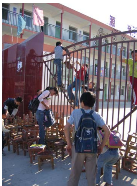
Après la fermeture de leur école à l'expiration de son bail, quelques élèves escaladent la barrière pour récupérer des chaises dans l'espoir d'installer une salle de classe ailleurs.

Si les écoles pour enfants migrants sont de mieux en mieux acceptées par les autorités centrales et locales, elles restent néanmoins à la merci de leur bon vouloir. Elles sont tolérées parce qu'elles répondent à un problème social que les autorités locales n'ont pas su gérer mais, comme le montrent les fermetures d'écoles à Pékin, elles restent menacées d'une fermeture soudaine et arbitraire, souvent dans un délai très court ou sans préavis, si leur présence gêne les autorités locales pour une raison ou pour une autre. Les raisons invoquées pour fermer ces écoles sont souvent les conditions de sécurité insatisfaisantes, ou le manque de personnel ou de moyens, ou encore l'absence d'autorisation officielle. Certes, ces raisons peuvent être réelles et légitimes, mais Amnesty International déplore qu'elles servent aussi souvent de prétextes.