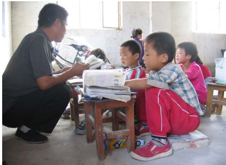
Dans l'impossibilité d'aller à l'école, un groupe d'enfants poursuit sa scolarité dans une pièce non meublée qu'on lui a prêtée. L'enseignant doit faire la classe accroupi par terre.

Après la publication de l'Avis de 2003 de la Commission de l'éducation sur l'amélioration du travail relatif à la scolarisation des enfants migrants, la plupart des municipalités ont adopté leurs propres réglementations, qui définissent les conditions que les migrants doivent remplir pour pouvoir inscrire leurs enfants à l'école publique locale. Ainsi, l'Avis de la ville de Shanghai sur l'amélioration du travail relatif à la fourniture d'un enseignement gratuit et obligatoire aux enfants migrants (2004) impose aux migrants de fournir un certain nombre de papiers qu'ils doivent demander aux autorités locales de leur localité d'origine, tels qu'un certificat attestant qu'ils ne sont venus à Shanghai que pour travailler. Il leur impose également de se procurer auprès des services « appropriés » (non précisés) de la municipalité de Shanghai des papiers certifiant qu'ils sont dans la ville pour y travailler, qu'ils y ont un domicile fixe et légal et qu'ils y vivent depuis « un certain temps » (non précisé) 125 . Seuls les migrants qui satisfont à ces critères peuvent demander aux services scolaires l'inscription de leurs enfants dans le système public.