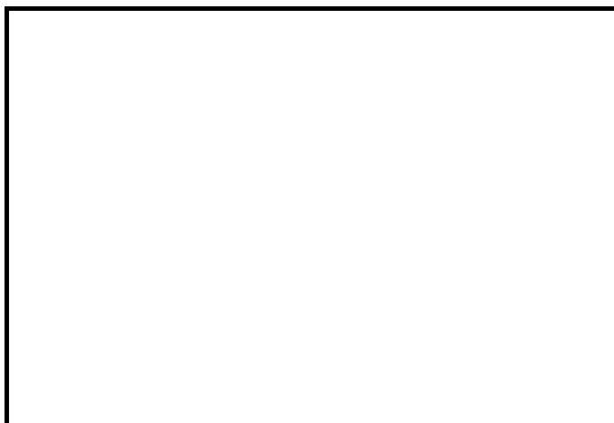
Trabajador migratorio recogiendo fibra desechada para reciclaje. (Diciembre de 2000)

Los grupos que observan la situación de los trabajadores chinos han informado de problemas serios y generalizados en lo que se refiere a las condiciones de trabajo, las cuales incumplen las normas internacionales y son causa de muertes y lesiones graves. Muchos trabajadores soportan condiciones de trabajo miserables, con falta de higiene y de ventilación en el lugar de trabajo. A menudo están expuestos a materiales explosivos o agentes químicos peligrosos, o tienen que realizar tareas arriesgadas sin poder tomar las precauciones necesarias. A consecuencia de ello, se calcula que, en los primeros seis meses del año 2001, unas 1.200 personas murieron en 64 accidentes laborales. 9 Otras estadísticas señalan que, en los nueve primeros meses de 1999, 3.464 mineros perdieron la vida en China. En 1998, según el Espacio Económico Especial Shenzhen ( Shenzhen Special Economic Zone, Shenzhen SEZ ), uno de los pocos organismos que han publicado estadísticas oficiales, 12.189 trabajadores sufrieron lesiones graves y 80 murieron en accidentes laborales en sus 9.582 fábricas, si bien se cree que el número real de siniestros es muy superior. 10 Datos oficiales citados en un informe indican que en Shenzhen una media de 13 trabajadores pierde un dedo o un brazo diariamente, y hay una muerte cada cuatro días y medio. 11