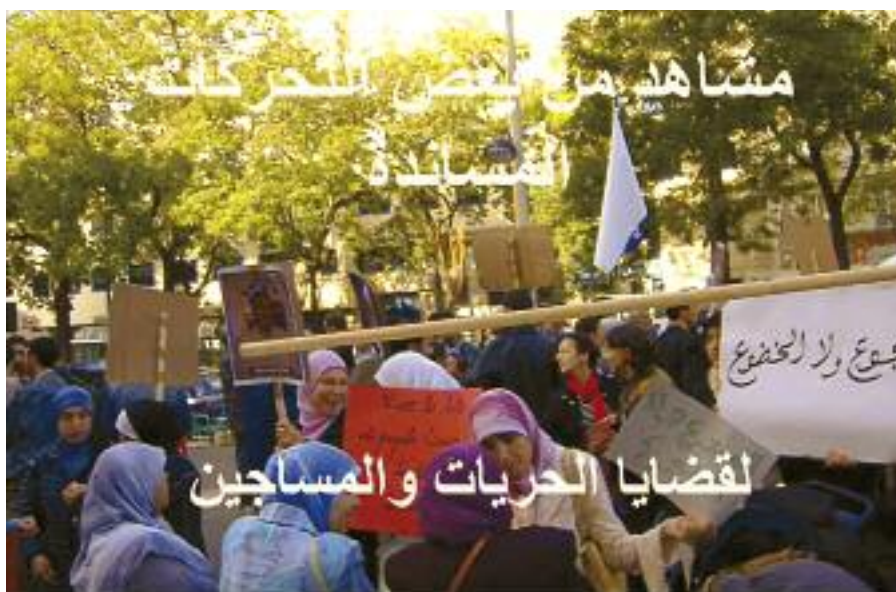
Image d'une manifestation organisée à Tunis en 2006, extraite d'une vidéo réalisée en soutien aux prisonniers politiques.

Ces mesures affectent gravement les vies de centaines d'anciens prisonniers politiques et de leurs proches. Elles entretiennent, à l'infini, la sanction infligée pour des actes passés et limitent très fortement les droits civils et politiques de ces personnes, tout comme leurs droits économiques, sociaux et culturels. Dans le