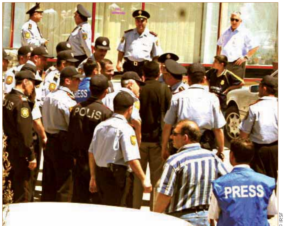
Des journalistes se voient empêcher d'entrer dans les bureaux des journaux Realny Azerbaycan et Gündelik Azerbaycan tandis que des agents de la Sécurité nationale procèdent à une perquisition (mai 2007).

www.youtube.com/watch?v=BRs-rPq2jnl&eurl ► Azerbaijan: Mixed messages on freedom of expression (EUR 55/002/2008)