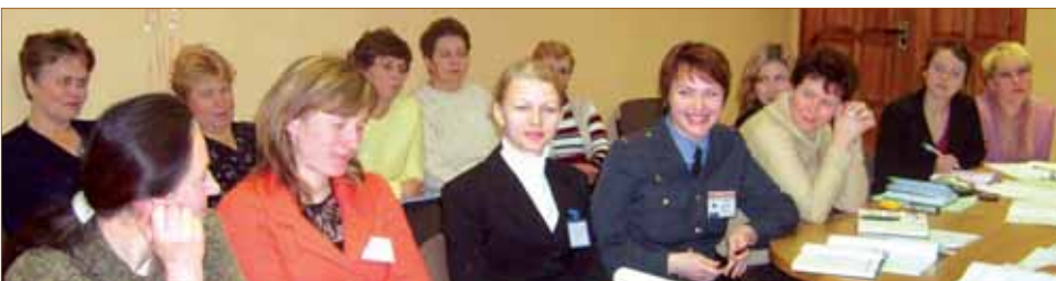
Séminaire de formation sur la prévention de la violence domestique, en Biélorussie. La police a été invitée à assister à toutes les sessions.

Passez à l'action ! Continuez d'envoyer des messages de soutien – avec du chocolat – aux ONG féminines en Biélorussie afin de leur exprimer votre solidarité. Faites parvenir vos messages à l'équipe d'Amnesty International chargée de la Biélorussie au secrétariat international, à l'adresse suivante : The Belarus Team, Amnesty International, International Secretariat, 1 Easton Street, London, WC1X 0DW, Royaume-Uni.