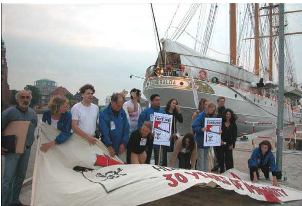
Manifestants sur le port de Bremerhaven, Allemagne, juin 2003