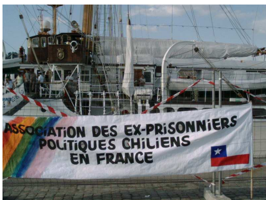
Bannière de l'Association des ex-prisonniers politiques chiliens en France, qui a participé aux manifestations sur le port de Rouen, France, juin 2003

À ce jour, les autorités n'ont toujours pas reconnu que des milliers de personnes avaient été victimes de la torture sous le régime militaire ; celles qui ont survécu réclament une reconnaissance officielle et la justice. Parmi elles se trouvent des victimes de tortures perpétrées à bord de l'Esmeralda. Le gouvernement chilien et les hauts responsables de la marine continuent de nier que des navires et des installations appartenant à la marine ont servi de centres de torture.