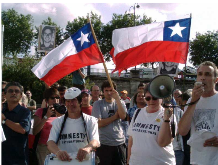
Manifestants au port de Rouen, France, juin 2003.