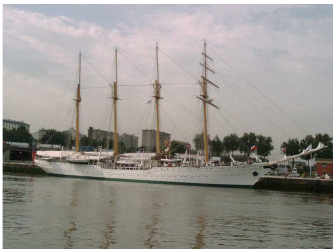
L'Esmeralda, arrimé au port de Rouen, France, Juin 2003.