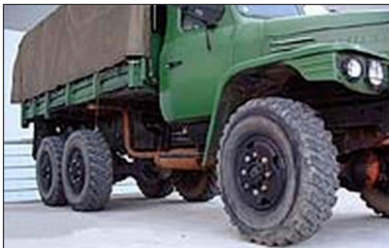
Fabriqué en Chine par la société Dong Feng, le camion militaire EQ2082E6D est le dernier né de la série EQ2081 ; il est équipé d'un moteur turbo diesel 6BT5.9, fabriqué par l'entreprise américaine Cummins 70 .

Quatre cents camions militaires de marque Aeolus, destinés au gouvernement du Myanmar seraient arrivés en août 2005 à Shweli, une ville birmane située près de la frontière chinoise 71 . Depuis 1988, la Chine fournirait régulièrement l'armée du Myanmar en équipement militaire, notamment en chars d'assauts, en véhicules blindés de transport de troupes et en pièces d'artillerie (obusiers, armes antichars et antiaériennes, etc.). Elle lui aurait livré, entre 1988 et 1995, environ un millier de véhicules, dont des camions Aeolus 6,5 tonnes, des camions Jiefang 5 tonnes, des camionnettes Lan Jian 2 tonnes, des camionnettes Kungi 2 tonnes, et quelque 300 autres engins tous terrains 72 . La Chine est devenue dans les années 1990 le premier partenaire commercial du Myanmar. Le gouvernement de ce pays aurait ainsi pu acquérir divers matériels militaires et obtenir de la Chine qu'elle forme un certain nombre de ses officiers, aux termes d'un contrat de vente d'armes portant sur une valeur d'un milliard de dollars des États-Unis. 73