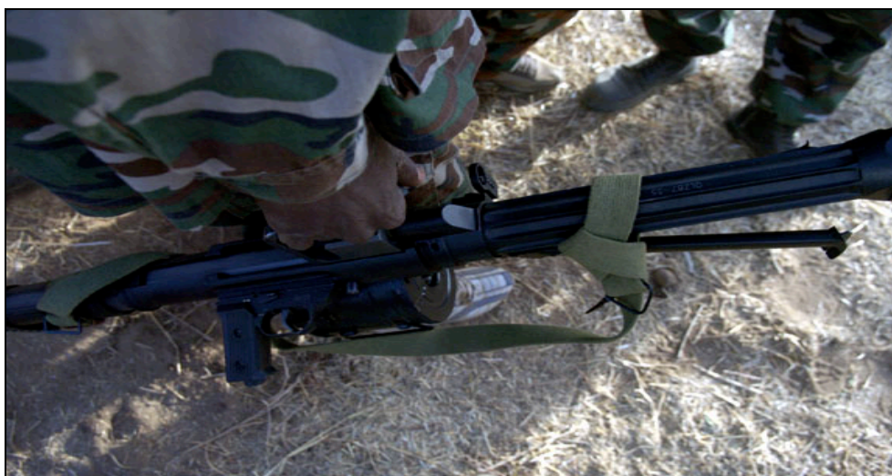
Un combattant d'un groupe armé tchadien opérant dans la zone frontalière entre le Tchad et le Soudan tient à la main un lance-grenades automatique de type QLZ87 35 mm, fabriqué par la société chinoise Norinco.

Des combattants du Front uni pour le changement démocratique au Tchad (FUCD) ont été vus en possession d'armes fabriquées par la société chinoise Norinco. Des membres de ce groupe ont été photographiés le 28 février 2006 avec des lance-grenades automatiques de type QLZ87 35 mm, aux portes de El Geneina, dans l'ouest du Darfour, en territoire soudanais, non loin de la frontière. Ces armes semblaient relativement récentes et on ne savait pas exactement comment elles avaient abouti entre les mains d'un groupe armé tchadien. Le QLZ87 a été présenté pour la première fois lors du salon international d'armement IDEX, qui s'est tenu en mars 2003 dans les Émirats arabes unis 42 .