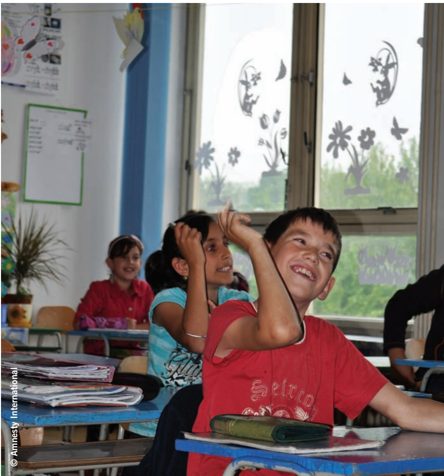
Rómski a nerómski žiaci počas vyučovania v zmiešanej triede na bežnej základnej škole v Pavlovciach na Uhom, Slovensko, máj 2010

deti, ako deti so špeciálnymi výchovno-vzdelávacími potrebami. Vo svojej podstate nerieši vzdelávacie potreby dieťaťa, ale posilňuje jeho nevýhodné postavenie tým, že dáva zlé sociálne podmienky na rovnakú úroveň s mentálnou kapacitou. Absencia účinných opatrení na zníženie vplyvu sociálneho znevýhodnenia a skutočnosť, že tento termín je často používaný ako synonymum pre Rómov, vedie k tomu, že sú rómske deti nesprávne zaraďované do systému špeciálneho školstva. Akonáhle sú deti identifikované ako „žiaci so špeciálnymi potrebami“, a zaraďené v paralelnom systéme špeciálneho školstva, sú vzdelávané podľa výrazne zredukovaných osnov.