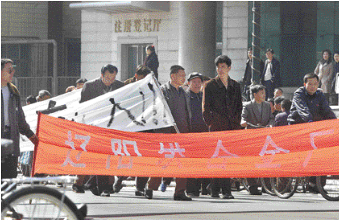
Le 19 mars 2002, des ouvriers manifestent à Liaoyang, une ville de la province de Liaoning, dans le nord-est de la Chine, pour demander la libération d'un dirigeant syndicaliste. Plusieurs représentants des travailleurs ont été arrêtés et inculpés de « rassemblement et manifestation à caractère illégal » pour avoir organisé des manifestations ayant réuni jusqu'à 30 000 personnes. Les conflits et les mouvements de protestation des travailleurs se sont multipliés ces dernières années en Chine pour dénoncer les licenciements massifs, la corruption de certains dirigeants, l'insuffisance ou le non-paiement des salaires, ainsi que des conditions de travail contraires à la législation. Les tentatives faites depuis la fin des 80 pour mettre en place des syndicats indépendants ont été brutalement réprimées et ont fait long feu.

Les entreprises exercent sur les gouvernements une influence qui va bien au-delà du domaine économique et commercial. Certaines ont pris l'initiative de mettre en place un code de conduite applicable à leurs activités et se sont engagées à respecter les normes internationales relatives aux droits humains.