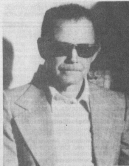
Huber Matos luego de ser liberado en 1979.